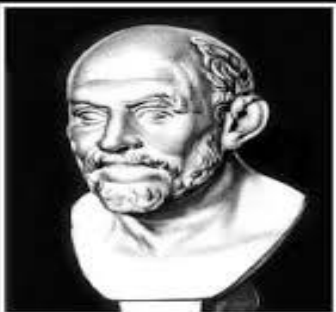
Демокрит ок. 460 — ок. 370 до н. э.