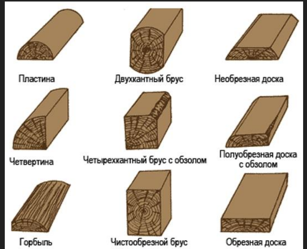
Пиломатериалы и заготовки