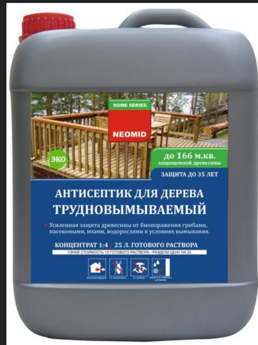
Маслянистый антисептик для защиты от насекомых