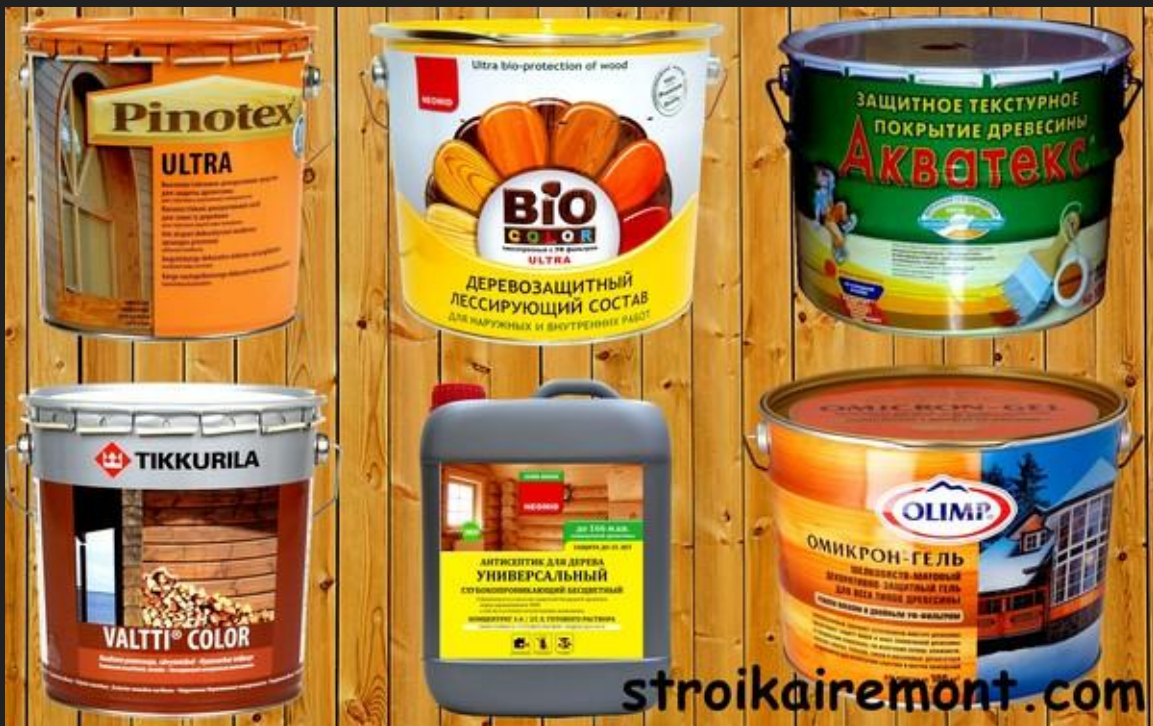
Антисептик для защиты от гниения