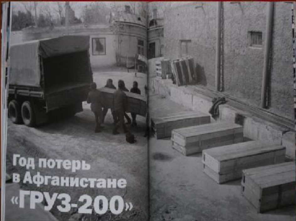
Год потерь в Афганистане «ГРУЗ-200»