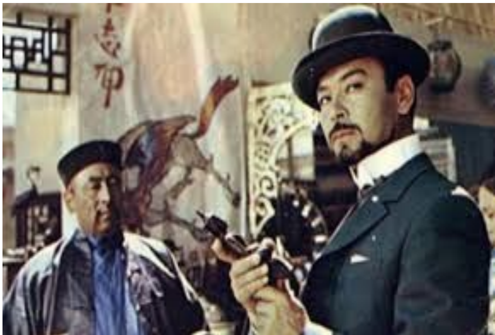
Ш.Аймановтың "Атаманның ақыры"