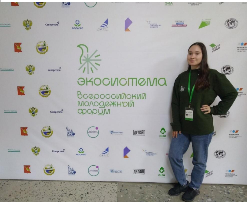
Всероссийский экологический форум «Экосистема» в г. Череповец