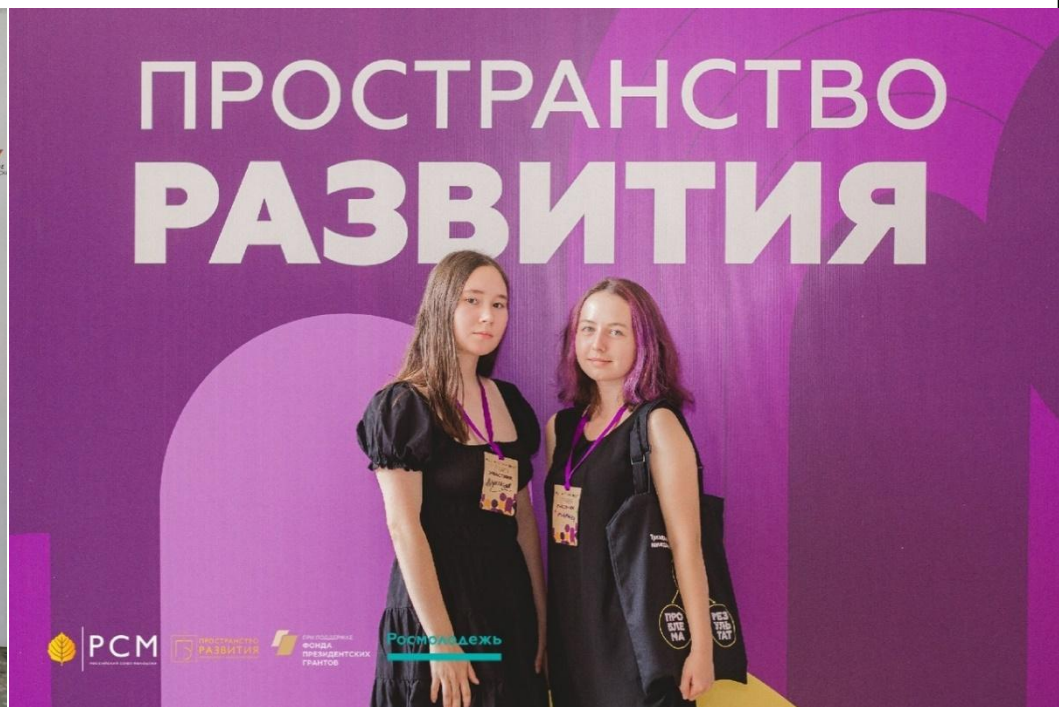
Итоговый форум от Российского Союза Молодежи «Пространство развития» в г. Ульяновск