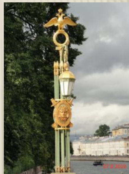
Мост Ломоносова Пантелеймоновский