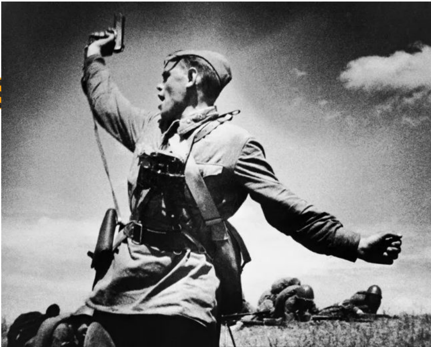
Фотография М. Альперта «Комбат»