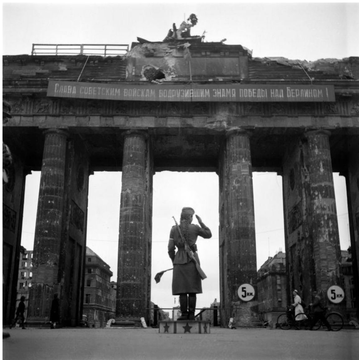
Фотография Е. Халдея «Регулировщица у Бранденбургских ворот»