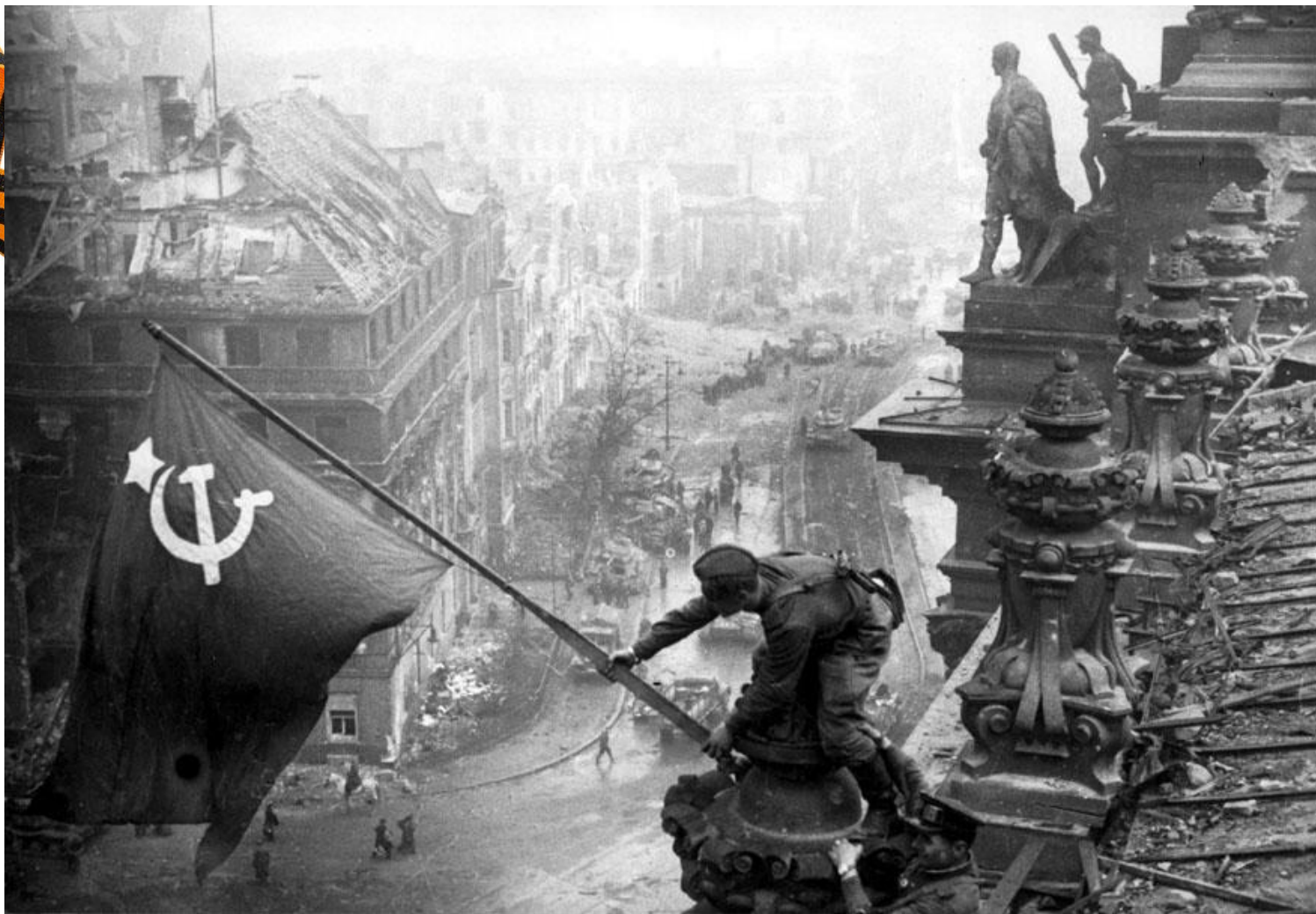
Фотография Е. Халдея «Знамя победы над Рейхстагом»