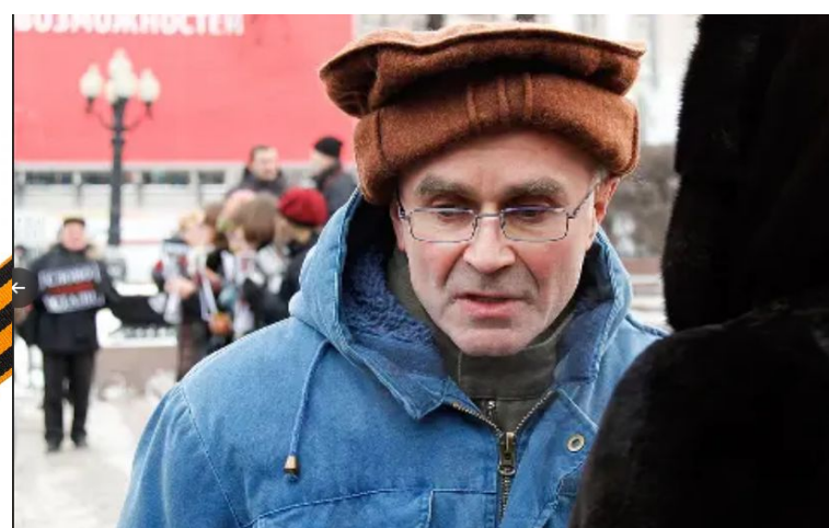
Андрей Николаевич Миронов