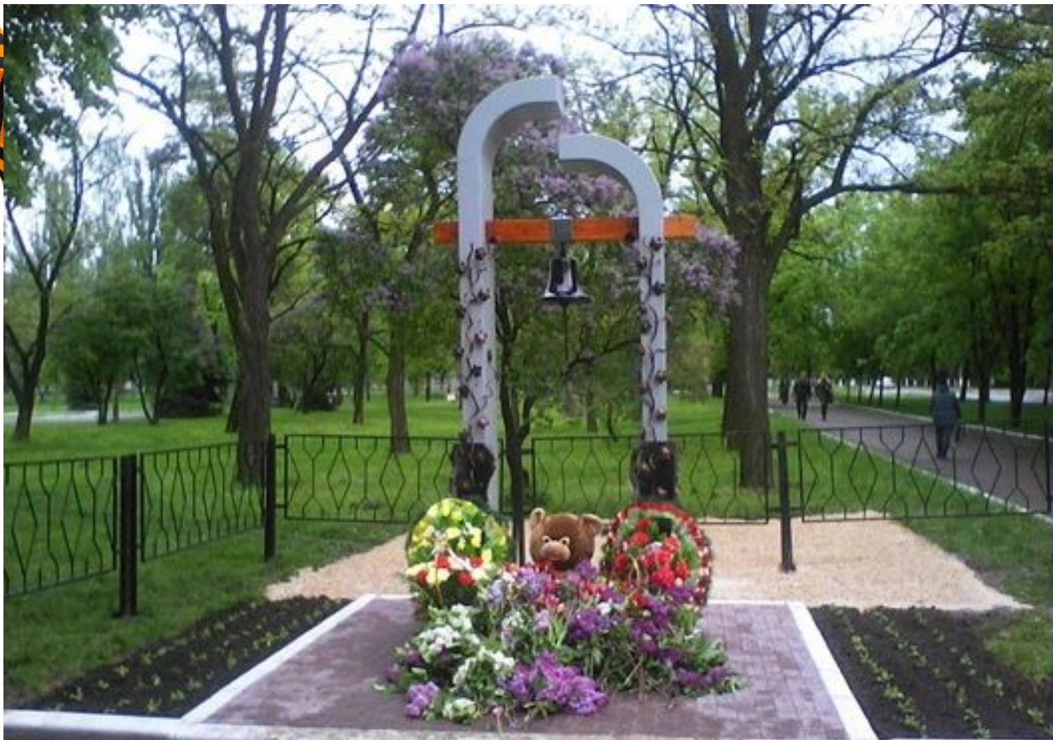
Памятник «Скорбь и печаль», Донбасс