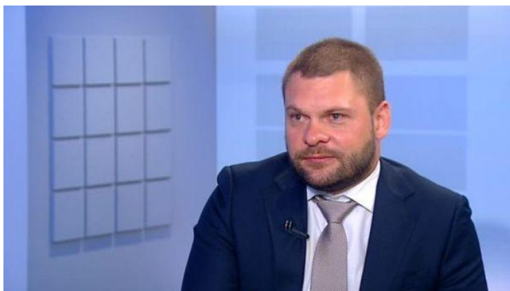
Евгений Евгеньевич Поддубный

Российский военный журналист, телеведущий программы «Вести в 23:00» и выпусков новостей телеканала «Россия-24», военный корреспондент ВГТРК