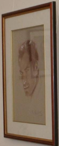
Small identification tag below the sixth portrait.