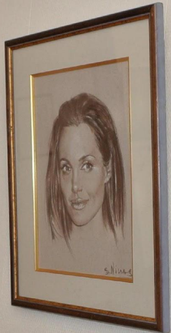
Small identification tag below the seventh portrait.