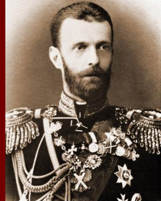
Великий Князь Сергей Александрович. Парадный портрет. 1900-е гг.