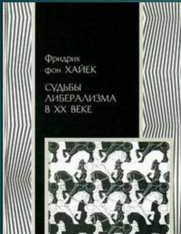
Судьбы либерализма в XX веке