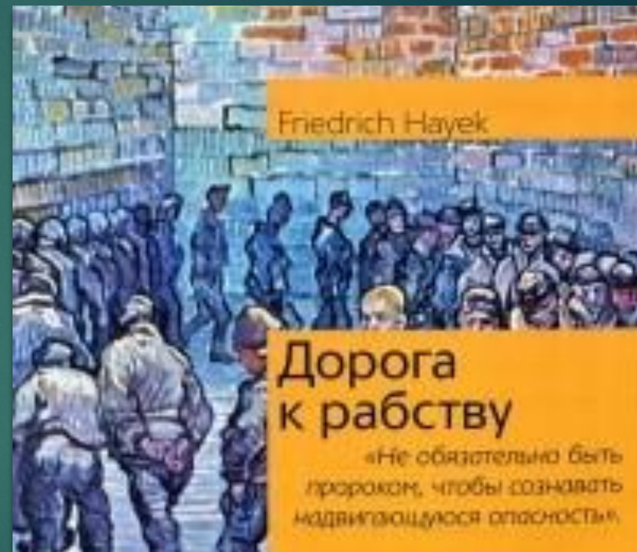
Дорога к рабству