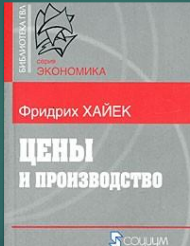
Цены и производство