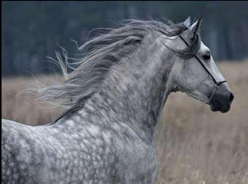
Лошадь серая в яблоках