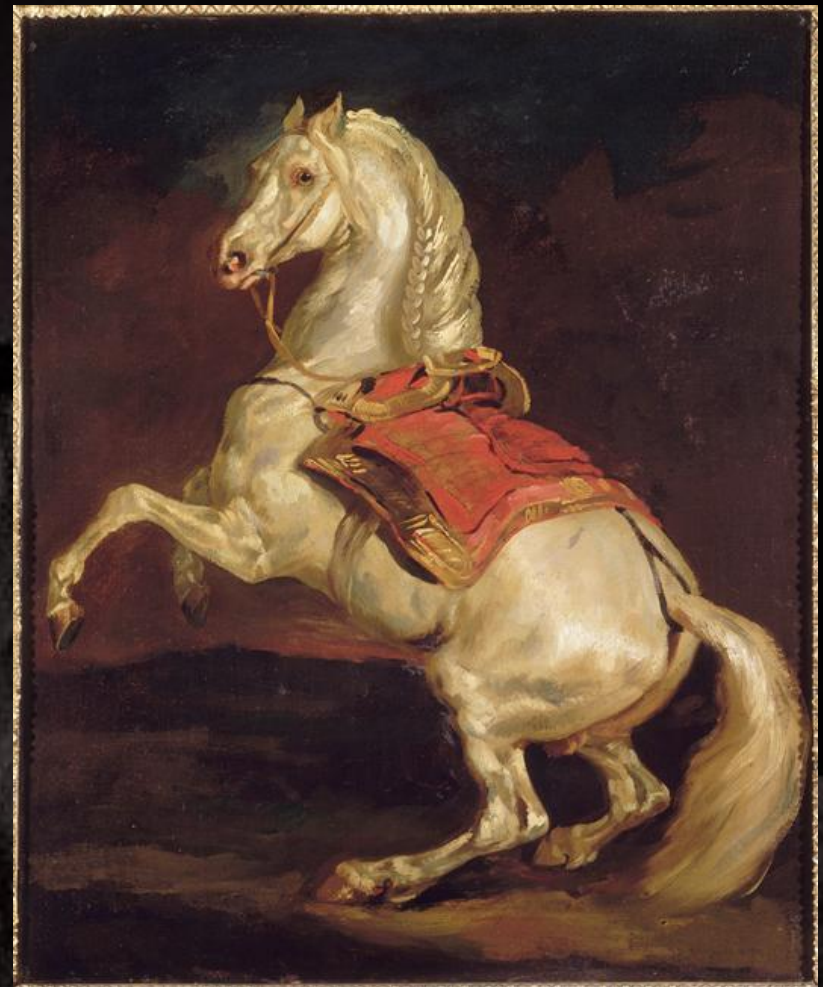
Теодор Жерико "Тамерлан - жеребец Наполеона"