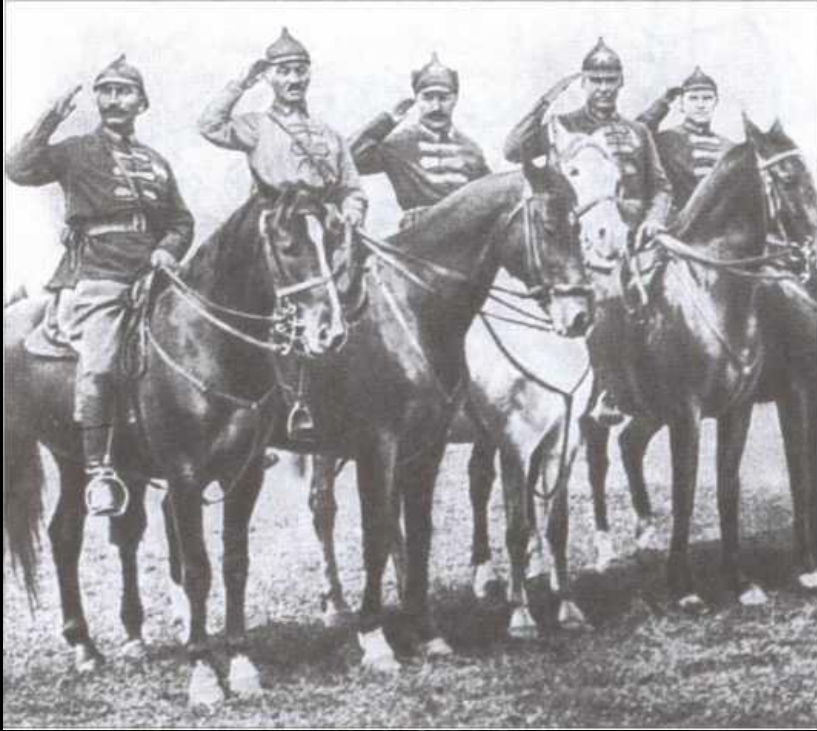
На параде частей Первой Конной армии. . 1923 г.