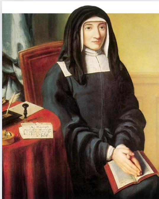
Рис.4- «Портрет Луизы де Мариллак, которую Викентий де Поль поставил во главе общины.

Вначале сестры действовали при женских монастырях и самостоятельных общинах,но вскоре Викентий де Поль указал, что община должна состоять из вдов и девиц, которые не должны быть монахинями и не должны давать никаких постоянных обетов. Он также впервые предложил словосочетания «сестра милосердия», «старшая сестра».