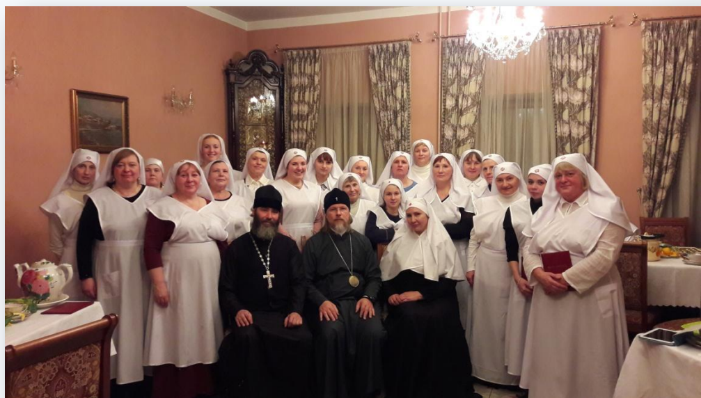
Рис.19- «Десятый выпуск курсов сестёр милосердия при Сестричестве», 2016г.