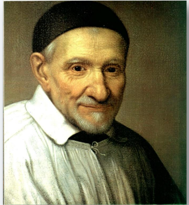
Рис.2- Святой Винцентий де Поль(1581-1660)

Он с удивлением заметил, что множество людей двигалось в том же направлении, неся съестные припасы. "Можно было подумать, что это крестный ход", - рассказывал он потом.