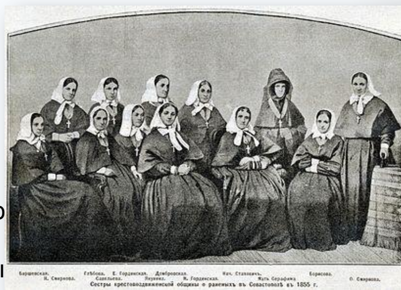
Рис.8- «Сестры Крестовоздвиженской общины, Севастополь, 1855 год»

В 1863 г. был издан приказ военного министра о введении по договоренности с Крестовоздвиженской общиной постоянного сестринского ухода за больными в военных госпиталях. Этот год можно считать годом рождения профессии медицинской сестры в России .