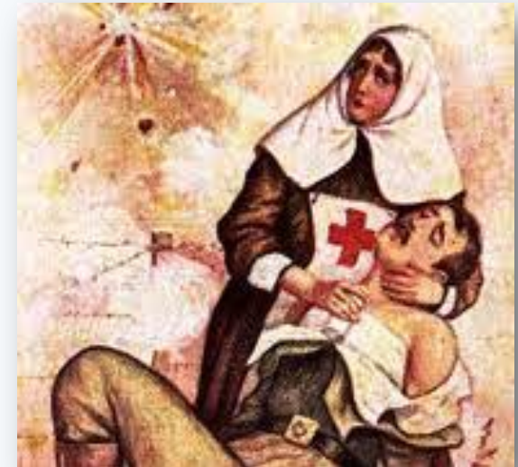
Рис.9,10- Сестры на полях сражения