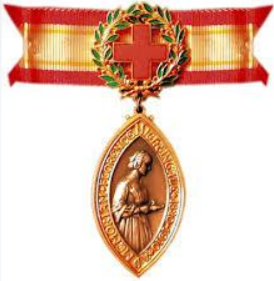
Рис.7«Медаль, изготовленная из позолоченного серебра»

Является высшей и самая престижной международной наградой медицинских сестер.