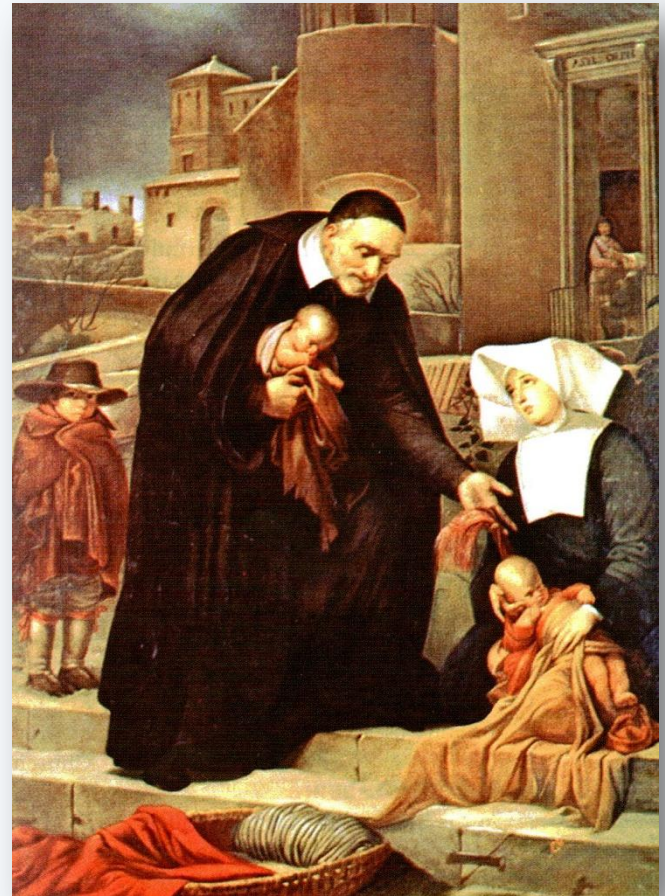
Рис.3- «Святой Викентий с сиротами»

Среди сподвижниц Винсента были королева Франции Анна Австрийская и будущая королева Польши Мария Гонзага.