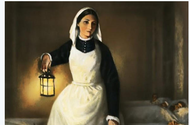
Рис.8,9- «Леди со светильником»