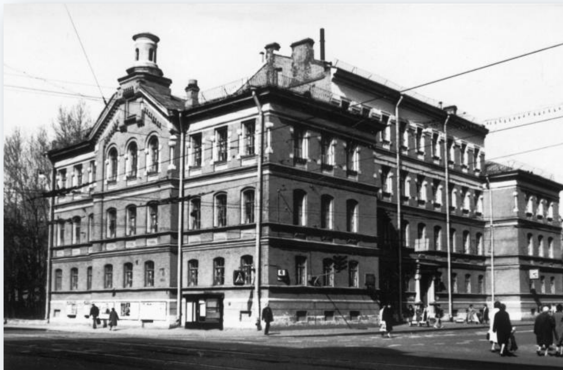
Рис.14-«Здание училища лекарских помощниц и фельдшерниц. Фото 1980-х г.»

Было основано в 1879 году Петербургским Дамским лазаретным комитетом. Именно оно и положило начало женским медицинским курсам. В этом училище обучение продолжалось четыре года, а слушательницам преподавали уже вполне научные дисциплины: физику, химию органическую и неорганическую, анатомию, гистологию, эмбриологию, токсикологию, общую патологию, латинский язык и т. п. Учитывая столь серьезное предназначение будущих выпускниц, правила приема в светские общины были достаточно жесткими.