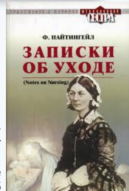
Рис.6,7- Портрет первой англ. сестры и её «Записки об