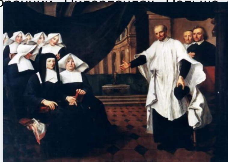
Рис.5- «Винсент и его «сестры милосердия»

Подобные институты сестер милосердия стали создаваться во Франции, Нидерландах, Польше и других странах.