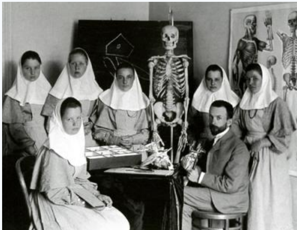
Рис.15- «Будущие фельдшерц ы на одном из занятий»

Для проведения практических занятий с сестрами милосердия общины имели свои больницы, амбулатории и аптеки. В мирное время все эти учреждения оказывали квалифицированную помощь населению, а в военное они поступают в распоряжение Главного Управления Красного Креста. Затем, исходя из создавшегося положения, община приступала к подготовке новых сестер в ускоренном режиме.