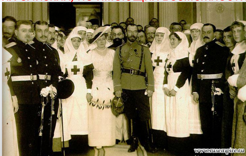
Рис.16 «Императорская семья, 1888»

«Слава Богу за то, что мы, по крайней мере, имеем возможность принести некоторое облегчение страждущим и можем им дать чувство домашнего уюта в их одиночестве. Так хочется согреть и поддержать этих храбрецов и заменить им их близких, не имеющих возможности находиться около них!» писала