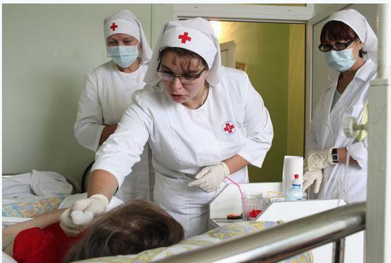
Рис.18- «сестры милосердия, ежедневно оказывающие квалифицированную медицинскую помощь и патронажный уход тяжелобольным подопечным православной службы «Милосердие» и больницы свт. Алексия.