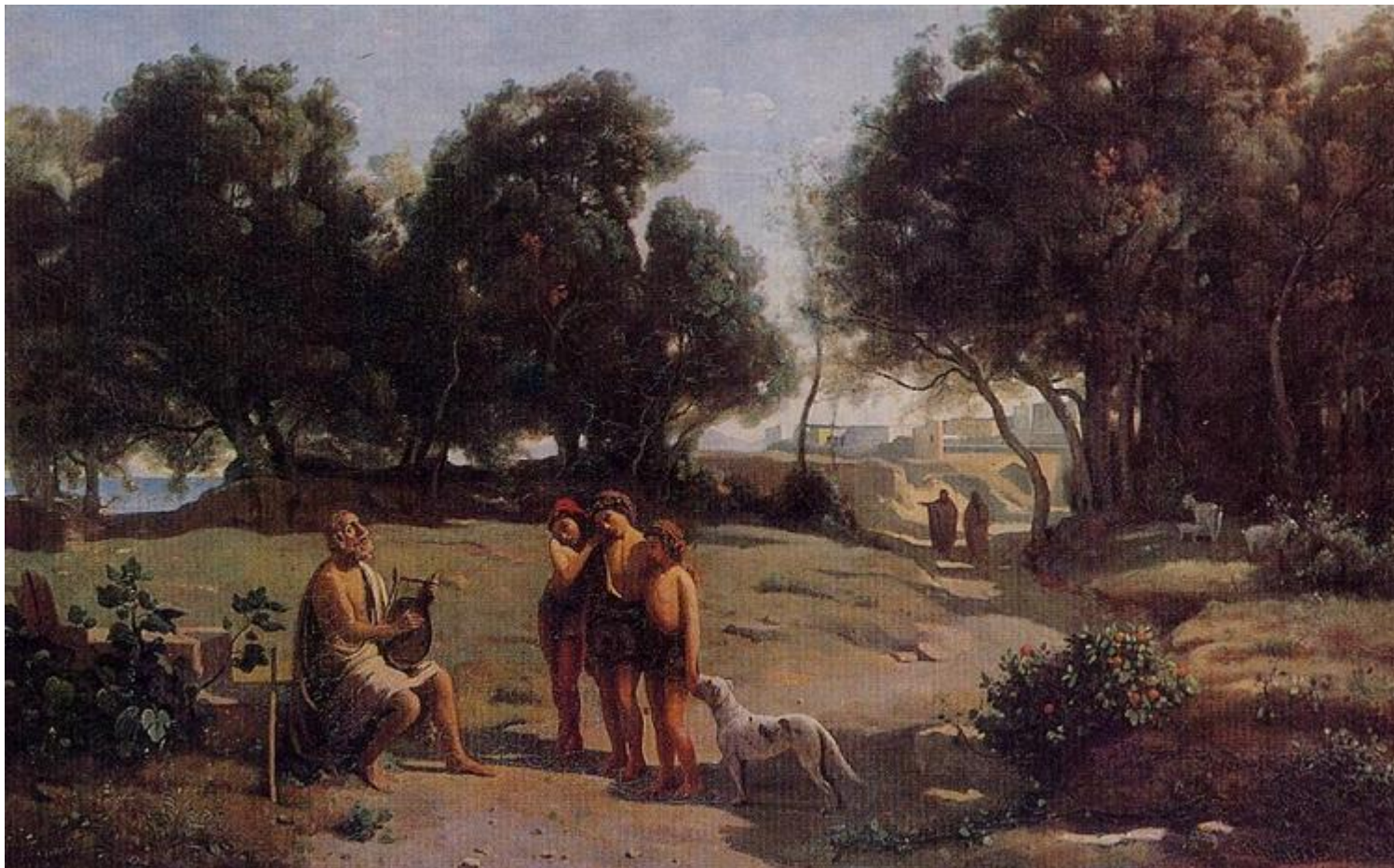
«Гомер и пастухи», 1845