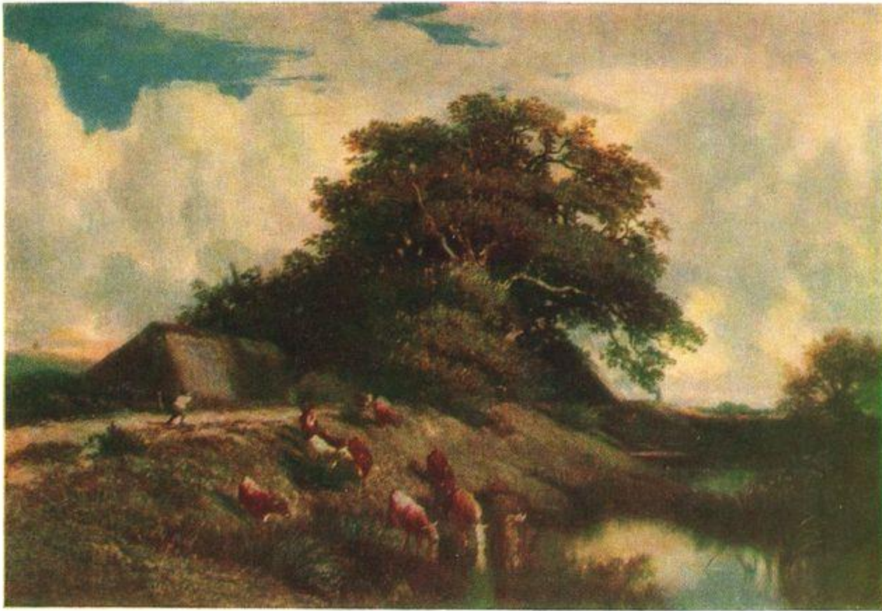
«Большой дуб» (1844 — 1855 гг.).