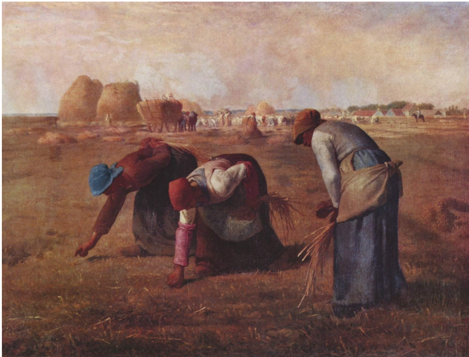
«Сборщицы колосьев» (1857 г.)