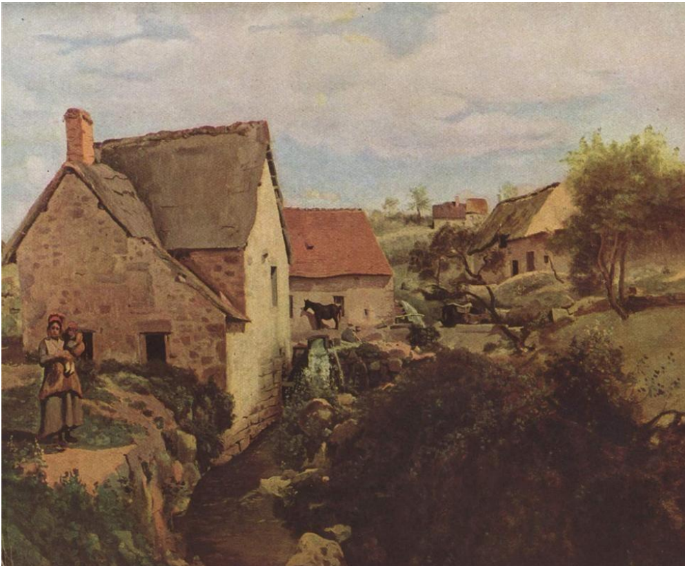
К. Коро «Мельница в Морване», 1831 г.