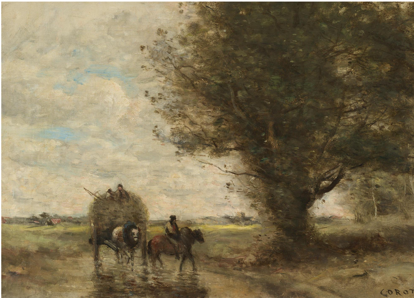
Воз сена. 60-е гг. XIX в.