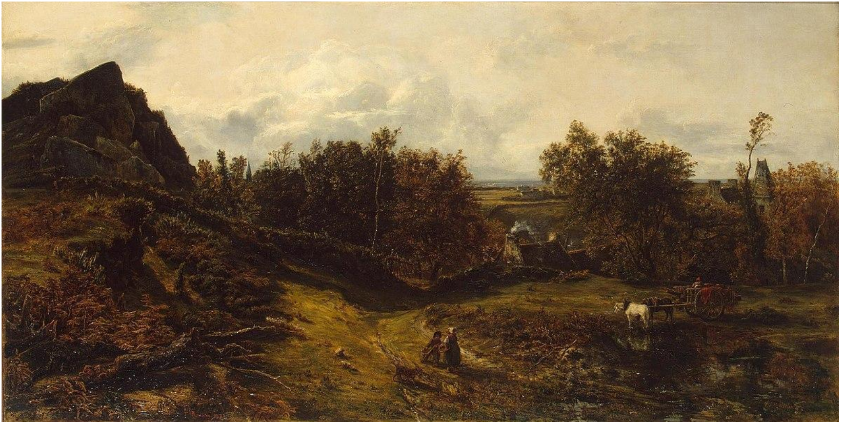
Вид в окрестностях Гранвиля. 1833 г.