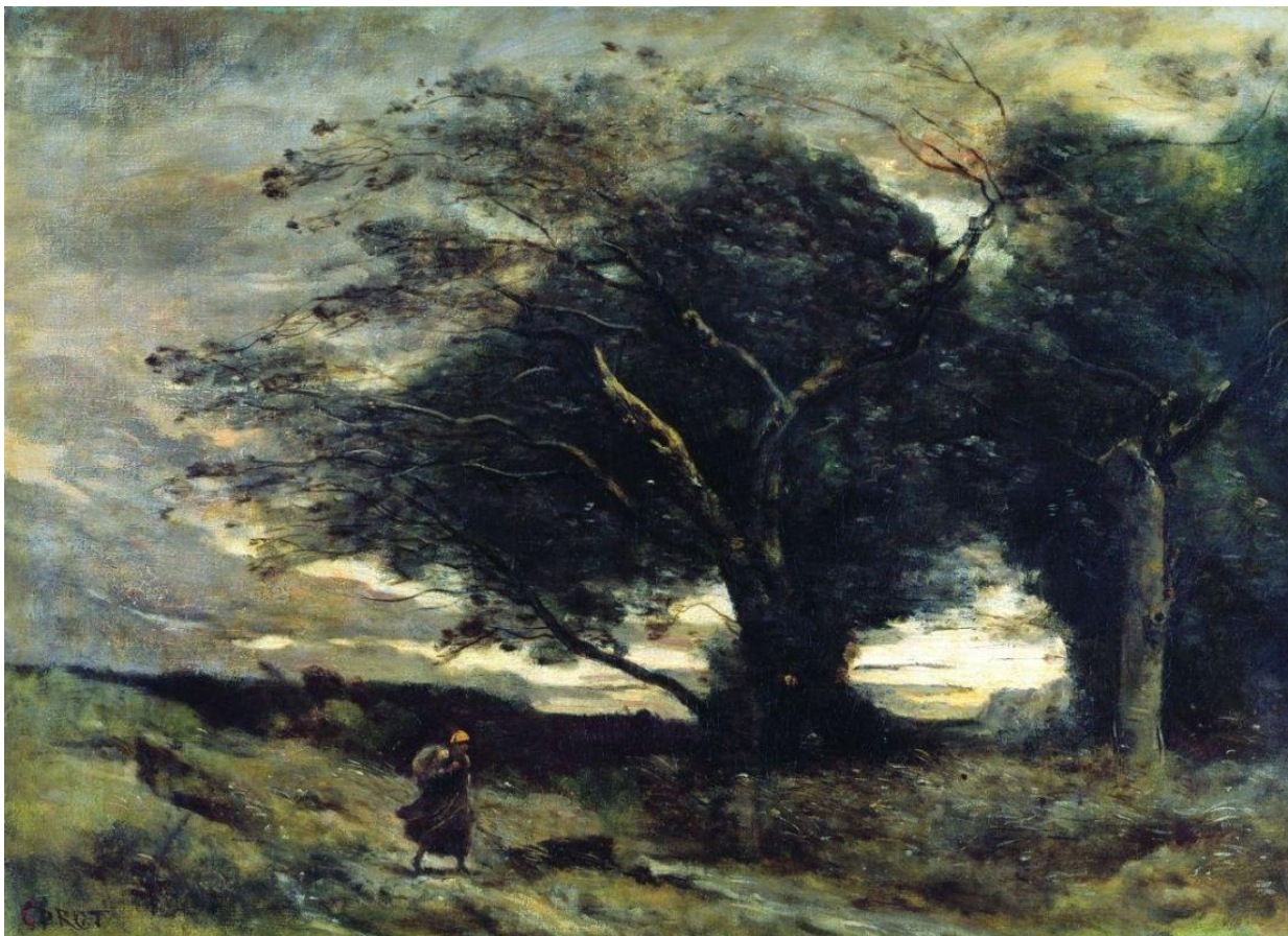
«Порыв ветра», 1864