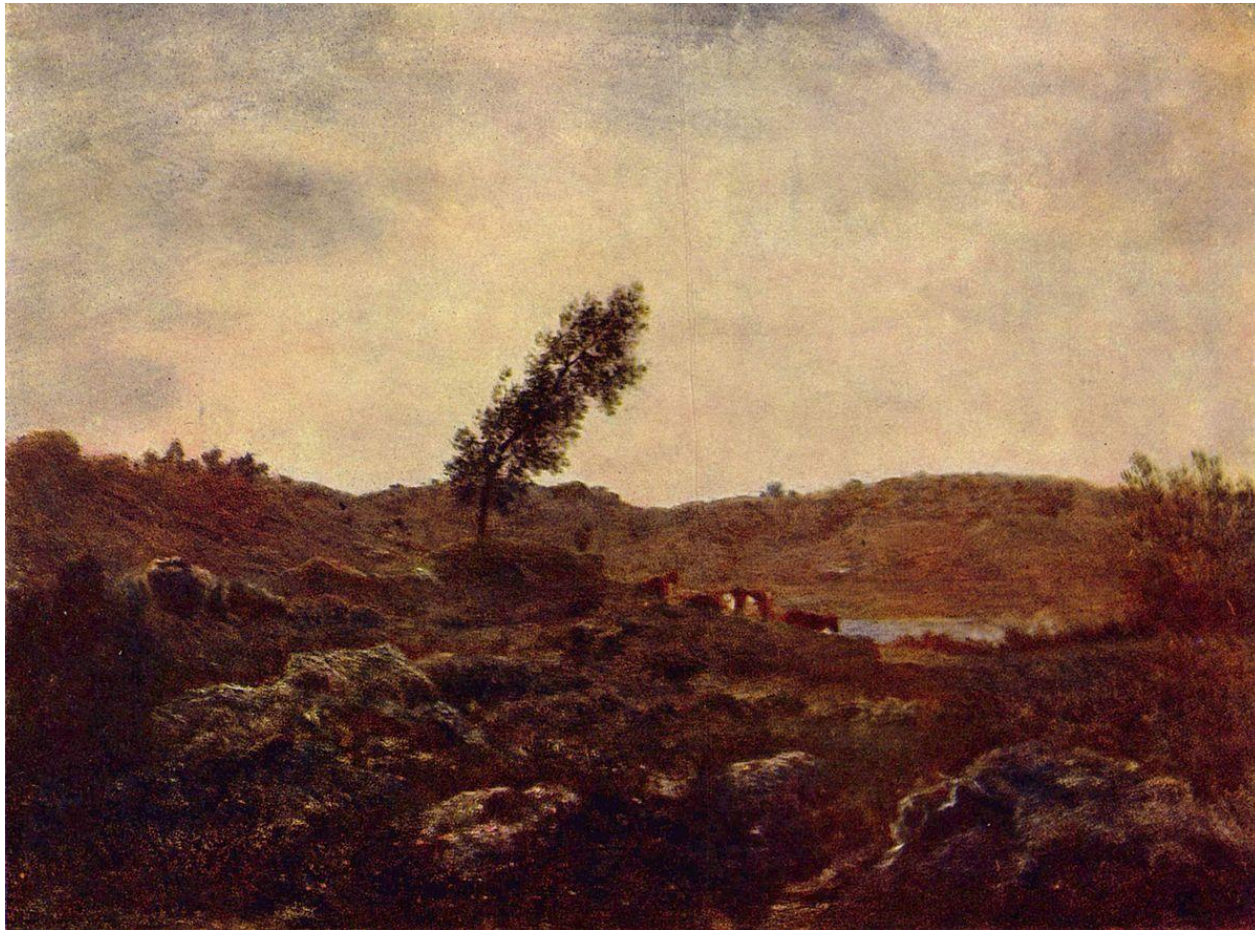
«Спуск коров с высокогорных пастбищ Юры», 1835 г.