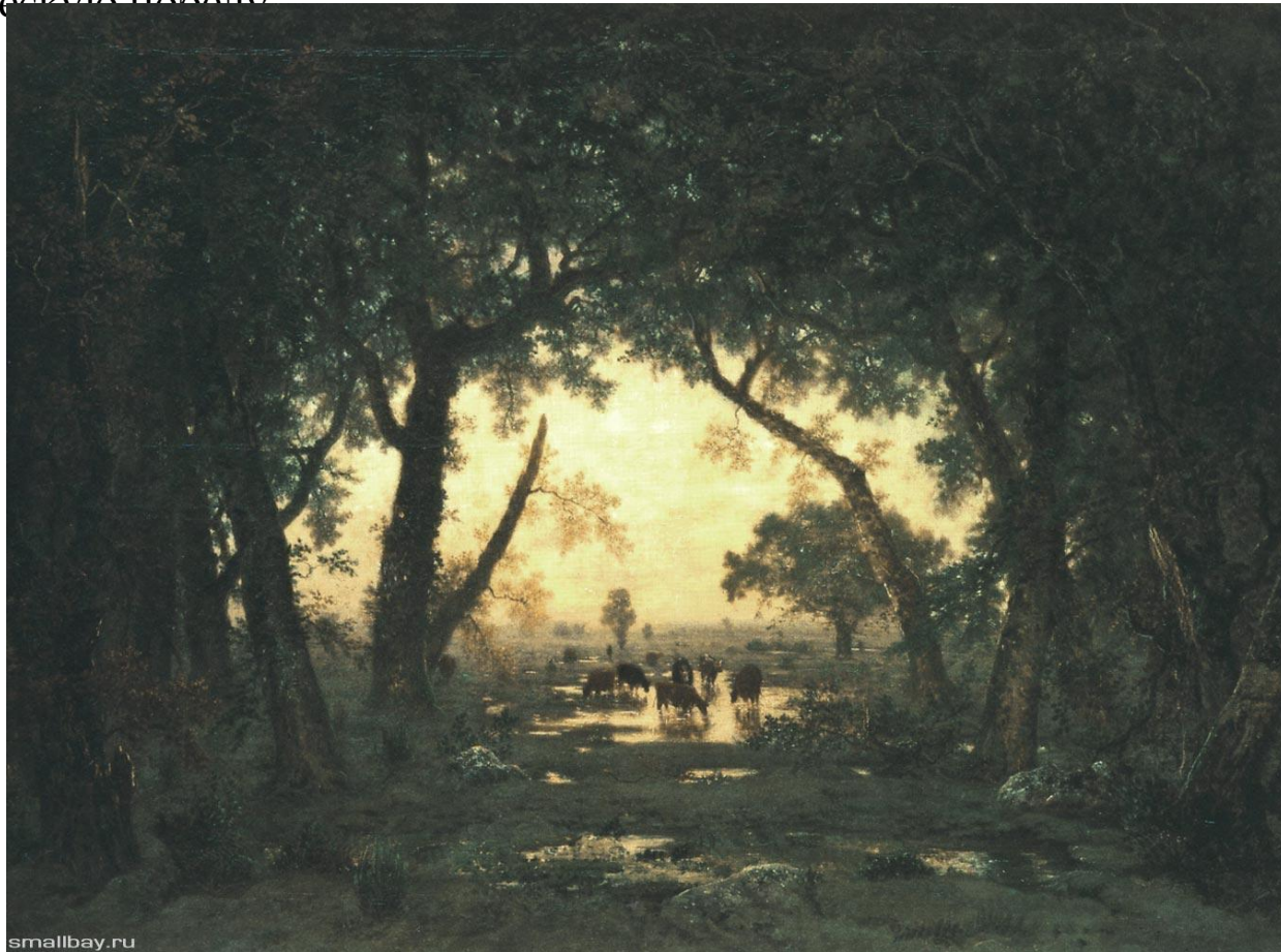
«Выход из леса Фонтенбло со стороны Броль. Заходящее солнце» (1848 – 1850 гг.)