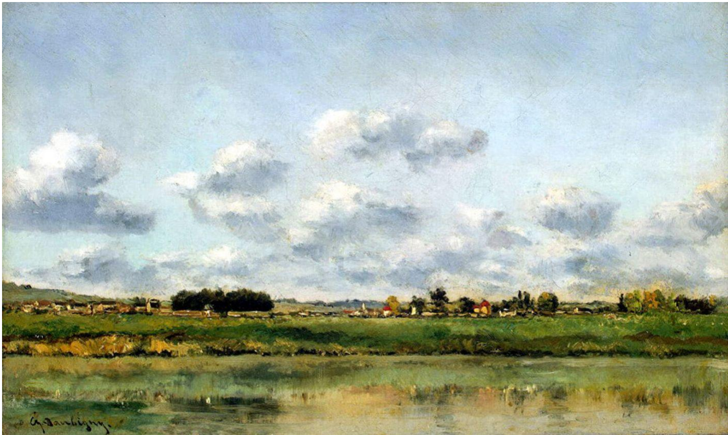
Берега реки Уазы. Конец 50-х гг. XIX