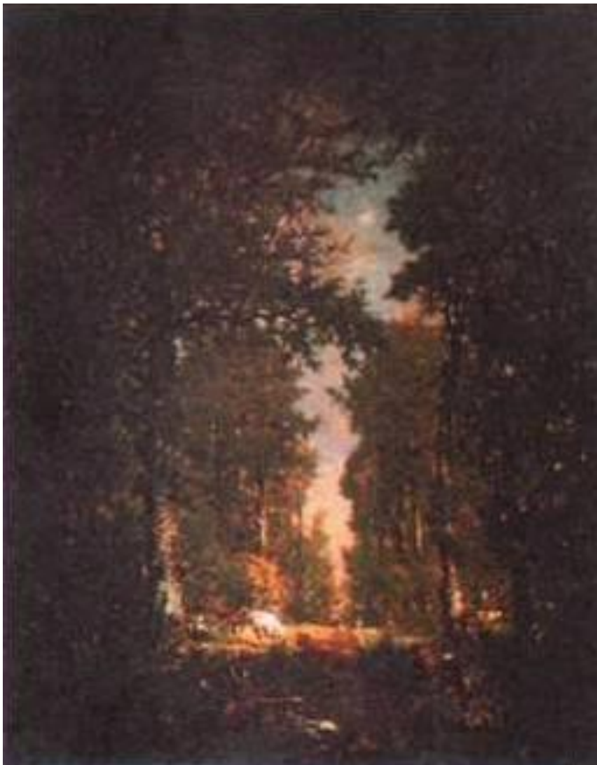
«Аллея в лесу Л'Иль-Адам» (1846–1849 гг.)