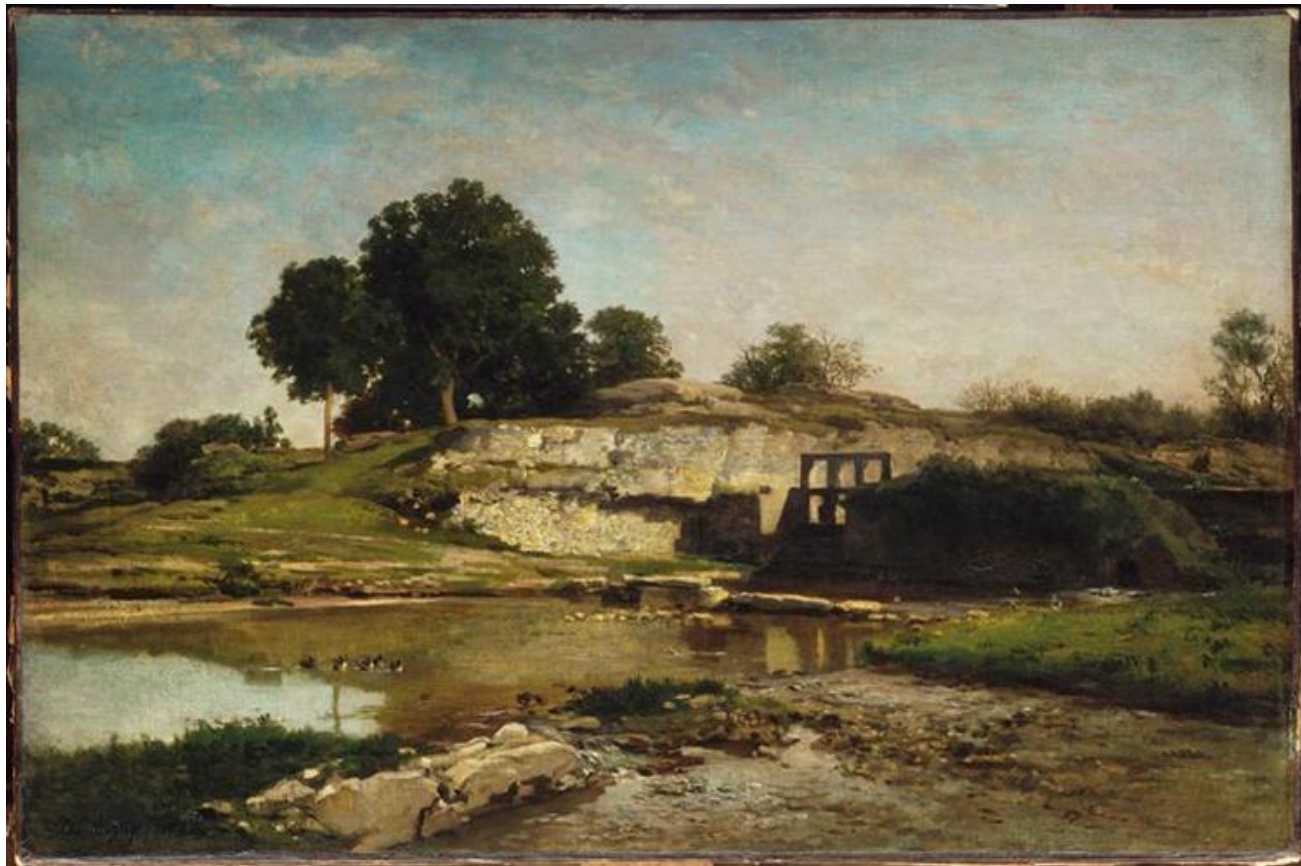
«Запруда в долине Оптево» (1855 г.)