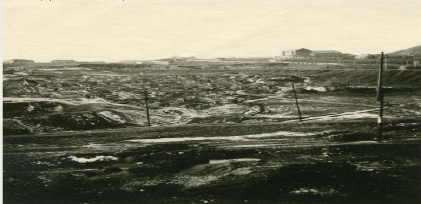
Белый карьер, весна 1942 г.

Большая часть евреев проживала в Белом карьере (ныне Ленинский район, возле цирка «Космос»)