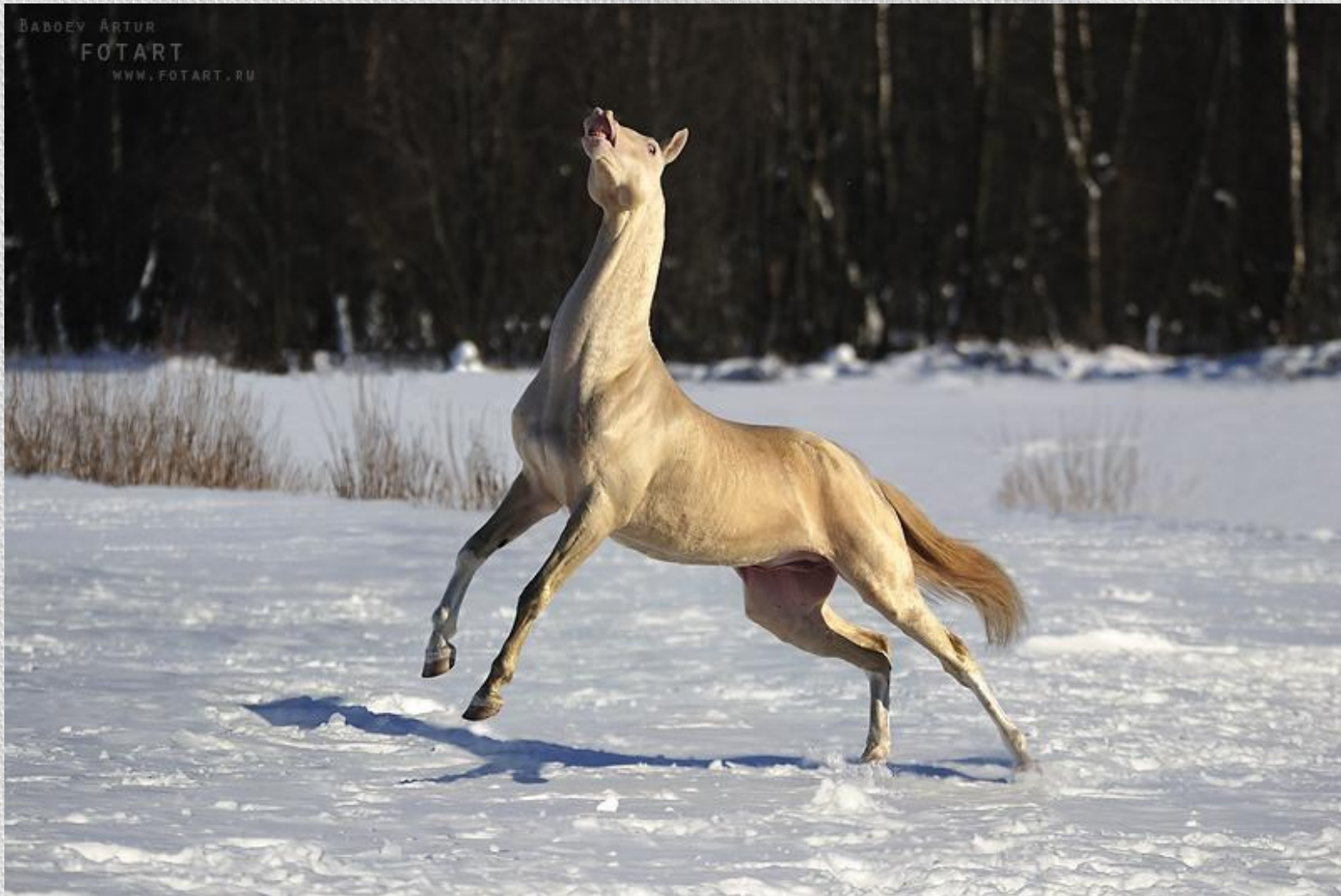
Лошадь Ахалтекинской породы, изабелловой масти

Известно более 100 пород лошадей. Лошади используются в различных целях.