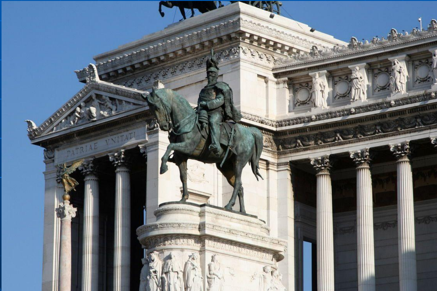
Памятник первому королю Италии