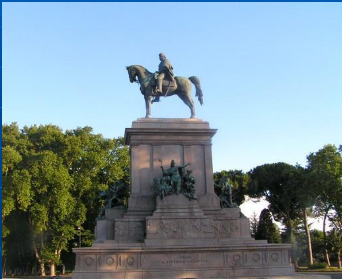
Памятник Гарибальди и его жене Аните