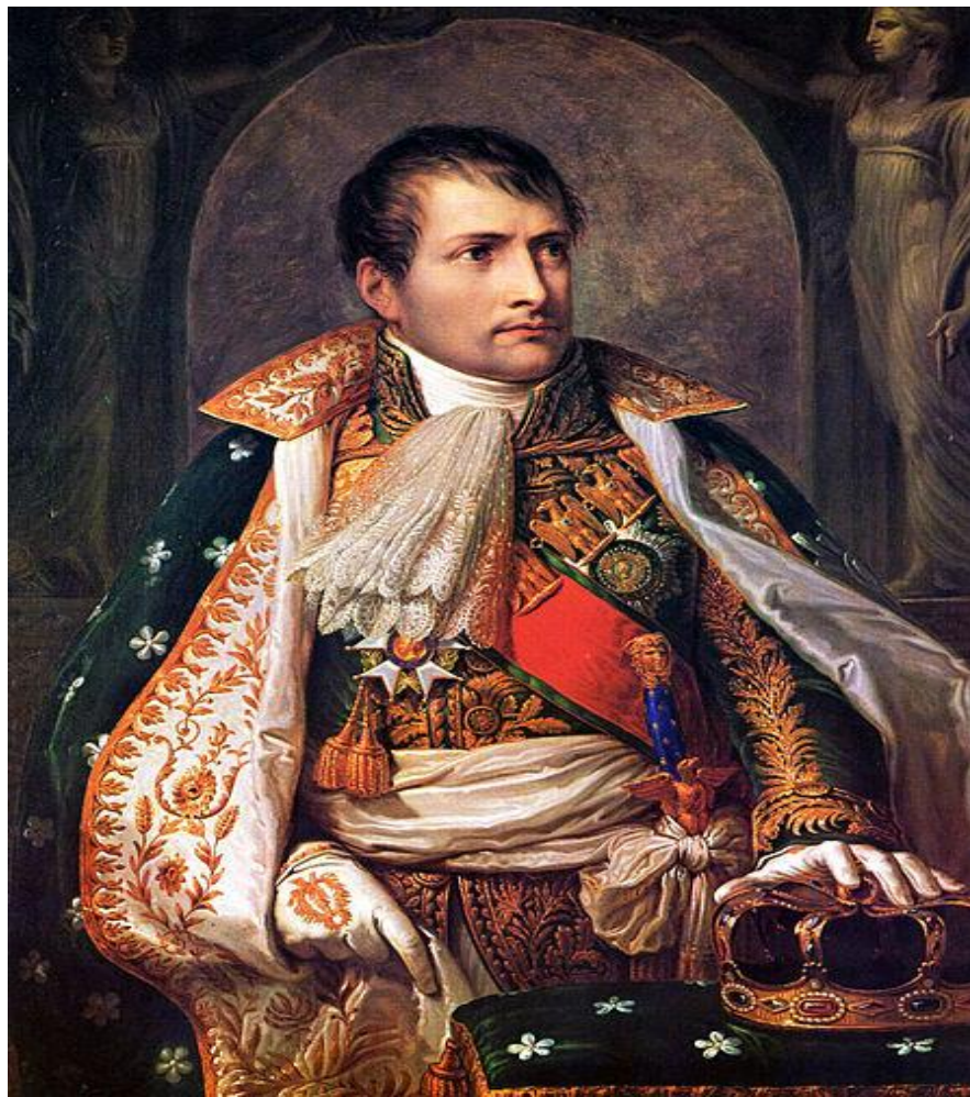
Наполеон I Бонапарт