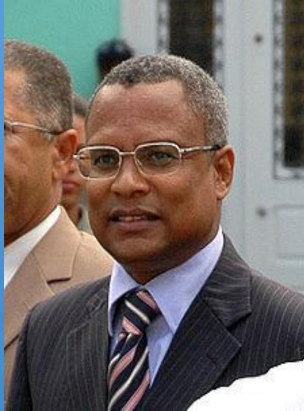
Премьер министрі: Невеш Жозе Мария