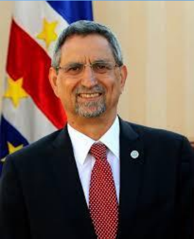
Президенті: Фонсека Жорже Карлуш