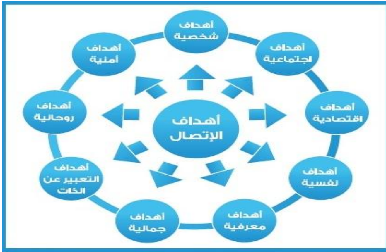
شكل (١-١٢) شكل يوضح أهم أهداف الإتصال