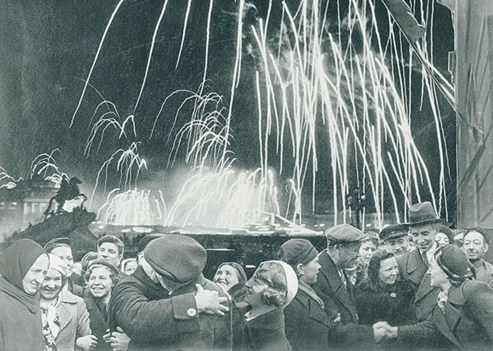
«ВЕЛИКАЯ ПОБЕДА ОДЕРЖАНА СОВЕТСКИМИ ВОЙСКАМИ ПОД ЛЕНИНГРАДОМ»