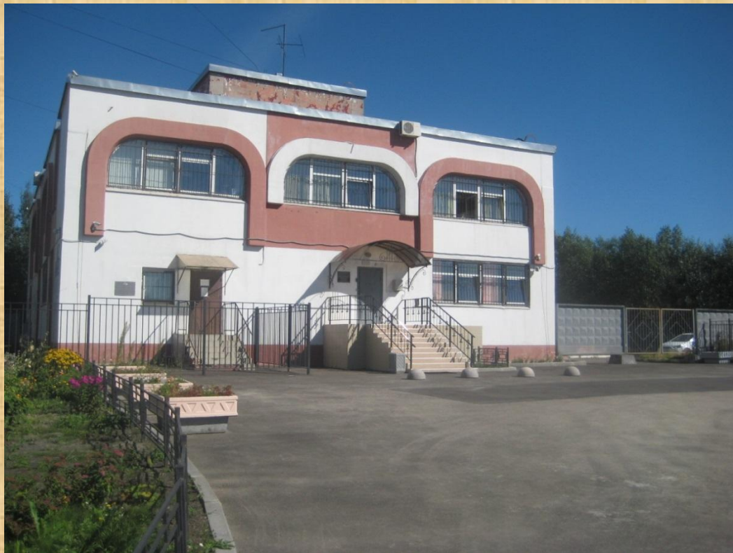
пр. Большевиков, дом 30, корпус 5

Консультации по телефонам: 362-85-88 417-52-87