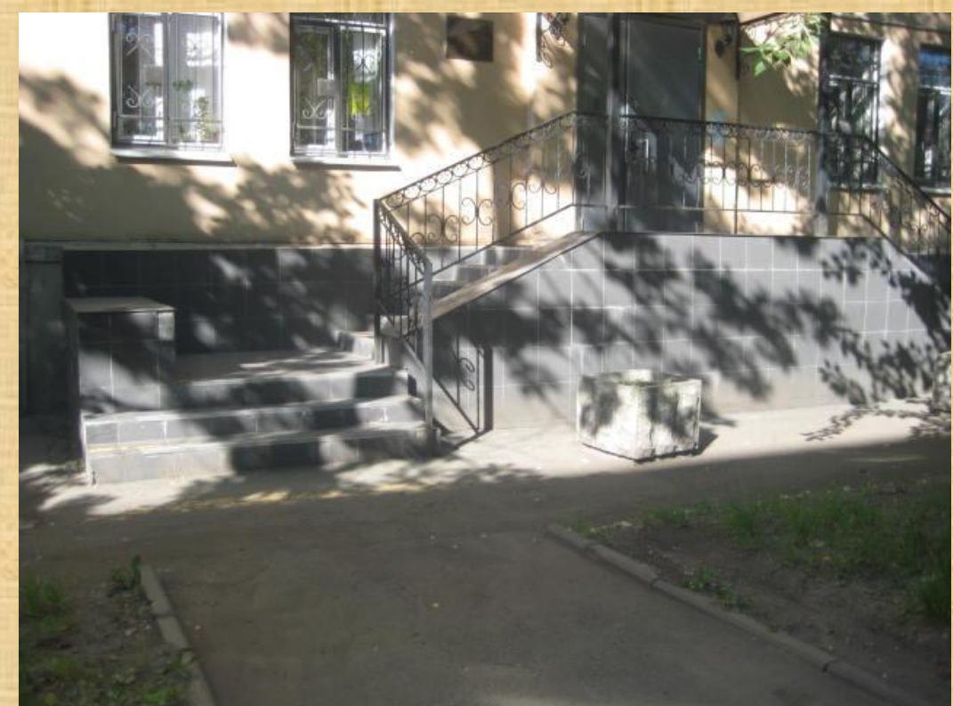
пр. Елизарова, дом 31, корпус 3