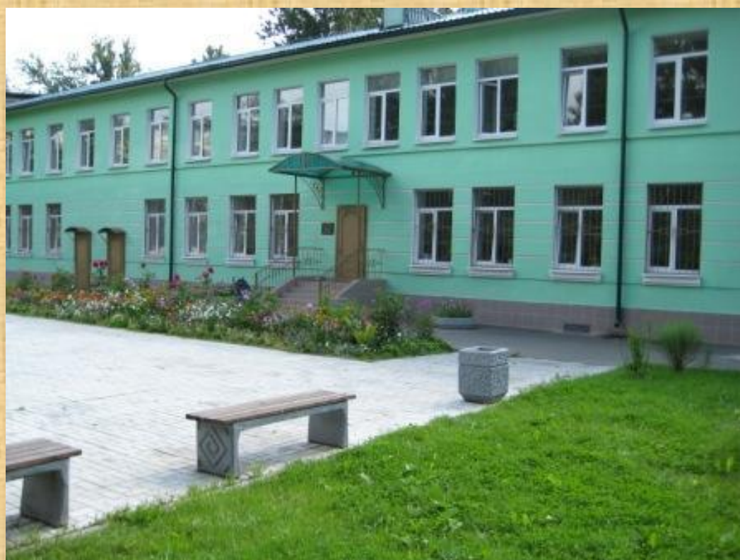
ул. Шелгунова, дом 17