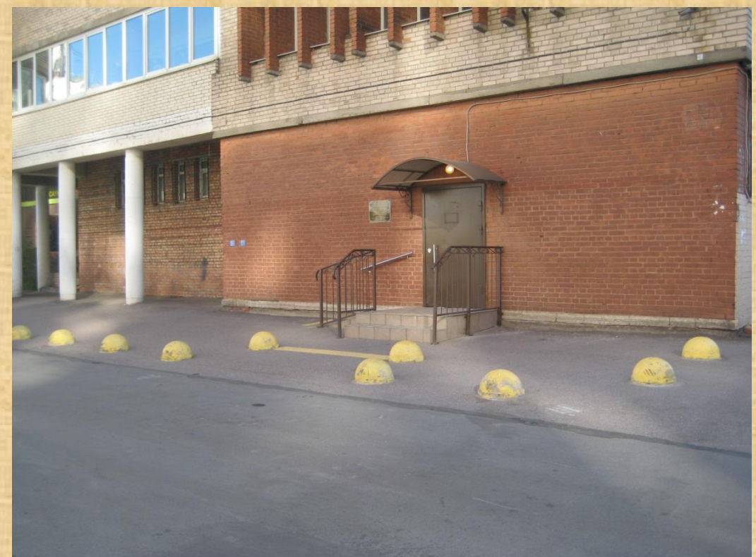
ул. Коллонтай, дом 7/2