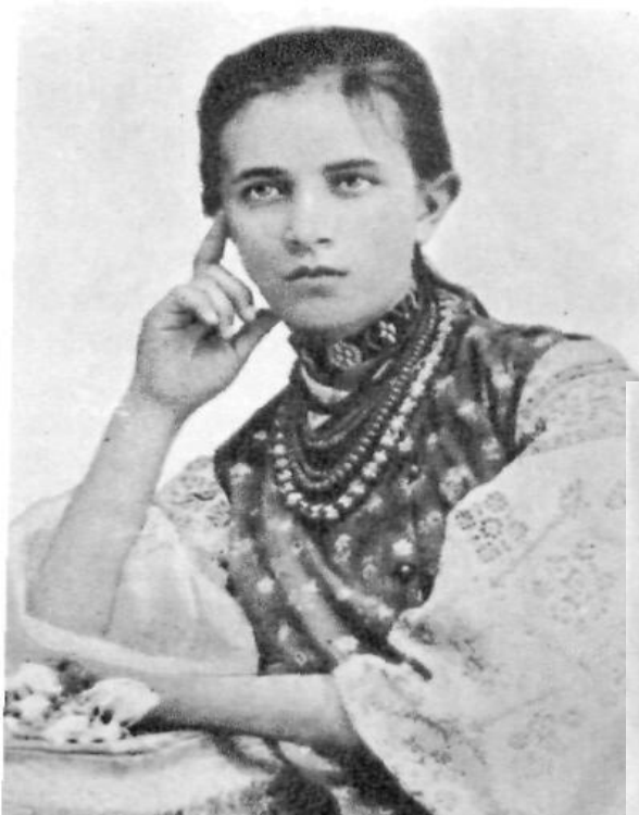
Молодша сестра Лесі Українки Ольга Косач