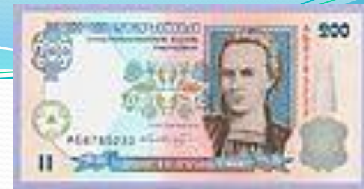
Банкнота 2001 року номіналом 200 гривень