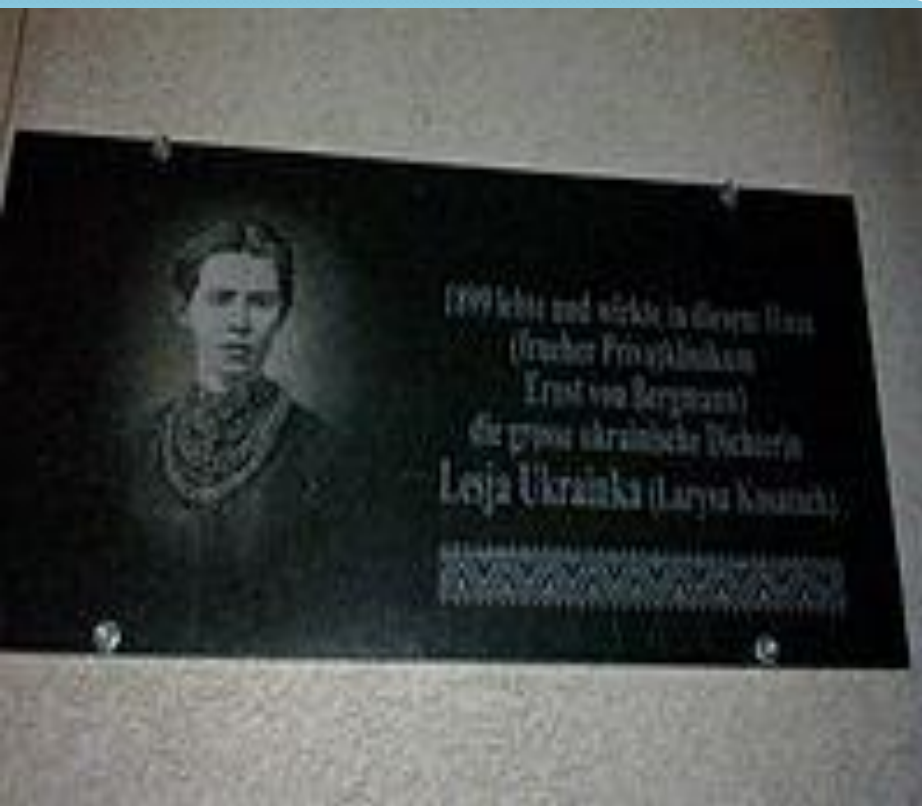
Пам'ятна дошка Лесі Українці в Берліні на Йоганнісштрассе (про лікування в 1899)