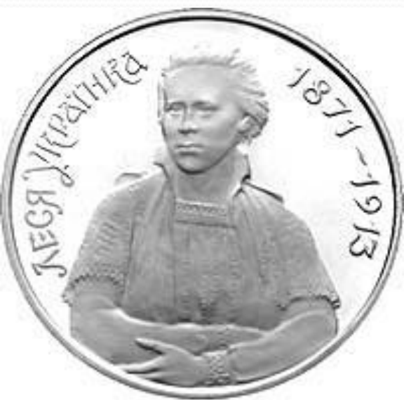
Пам'ятна монета, присвячена 125-річчю з дня народження