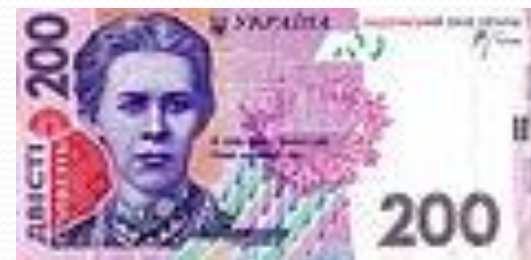
Банкнота 2007 року номіналом 200 гривень