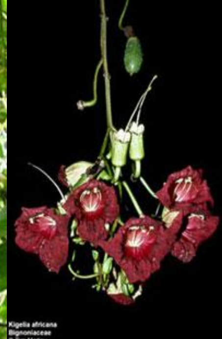
Kigelia africana Bignoniaceae