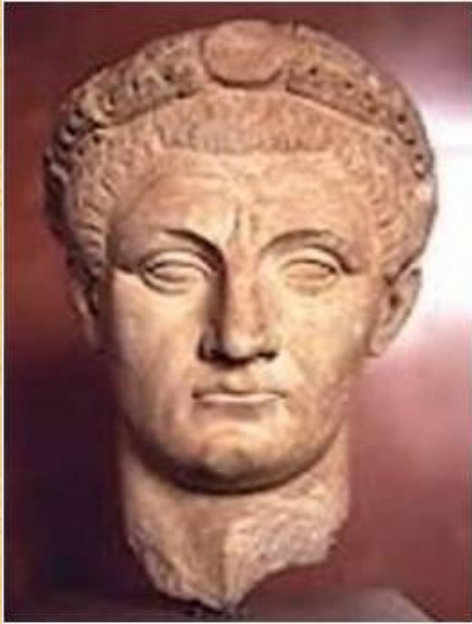
Аппій Клавдій Сл