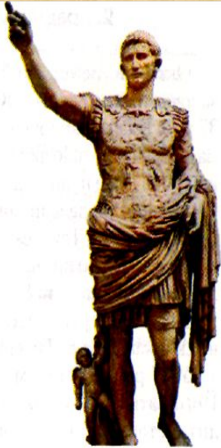
Імператор Октавіан Август

Епоха Августа - період розквіту римської культури. У його час були створені такі твори літератури і мистецтва, які придбали всесвітньо-історичне значення і протягом багатьох століть залишалися зразками. Ці твори - результат багатолітнього розвитку римської культури, але в той же самий час вони висловлюють ті ідейні течії, які характерні для епохи Августа.