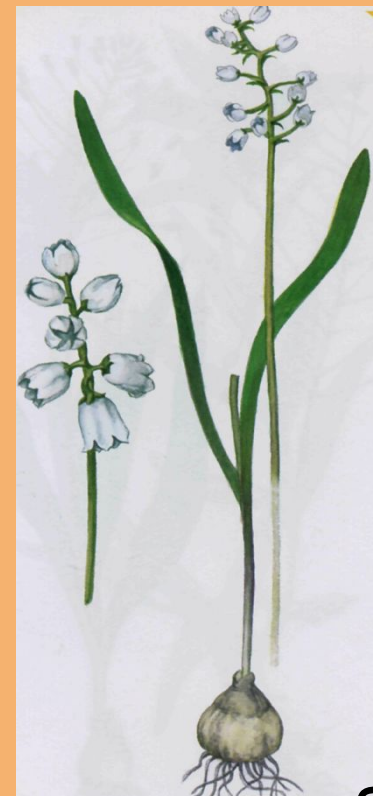
Голубая Благодатник светло-голубой