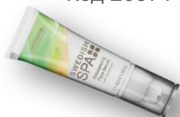
Восстанавливающая сыворотка Код 20373