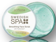
Выравнивающий скраб Код 20371