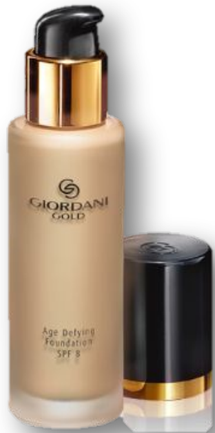
Антивозрастная тональная основа Коды 32047 - 32051