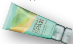
Очищающая маска Код 20372