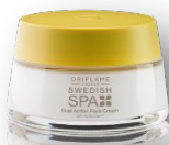
Крем для лица Код 23735