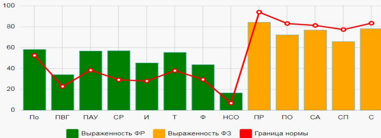
Вероятность вовлечения в зависимое поведение, в %