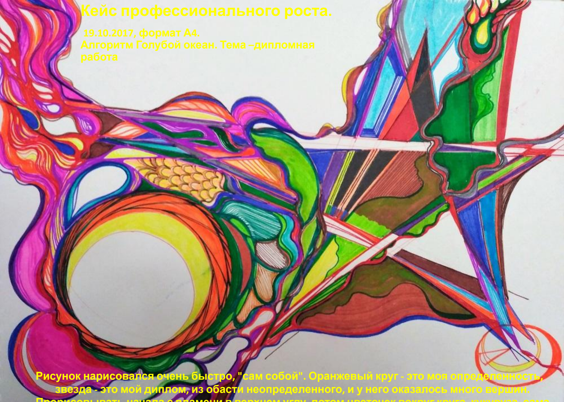
Рисунок нарисовался очень быстро, "сам собой". Оранжевый круг - это моя определенность, звезда - это мой диплом, из области неопределенного, и у него оказалось много вершин. Прорисовывать начала с пламени в верхнем углу, потом цветочек вокруг круга, кукуруза, сама звезда. Кружок в правом нижнем углу мне приснился. Рисунок дал мне много энергии, он

Алгоритм Голубой океан. Тема – дипломная работа