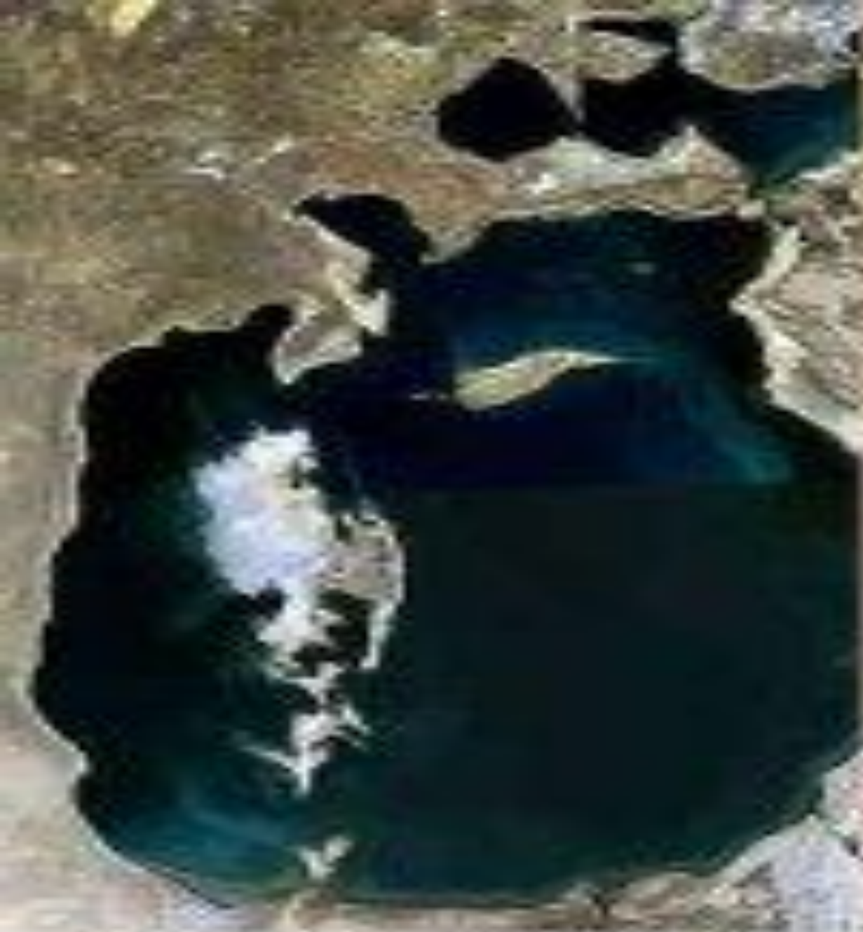
July - September, 1989