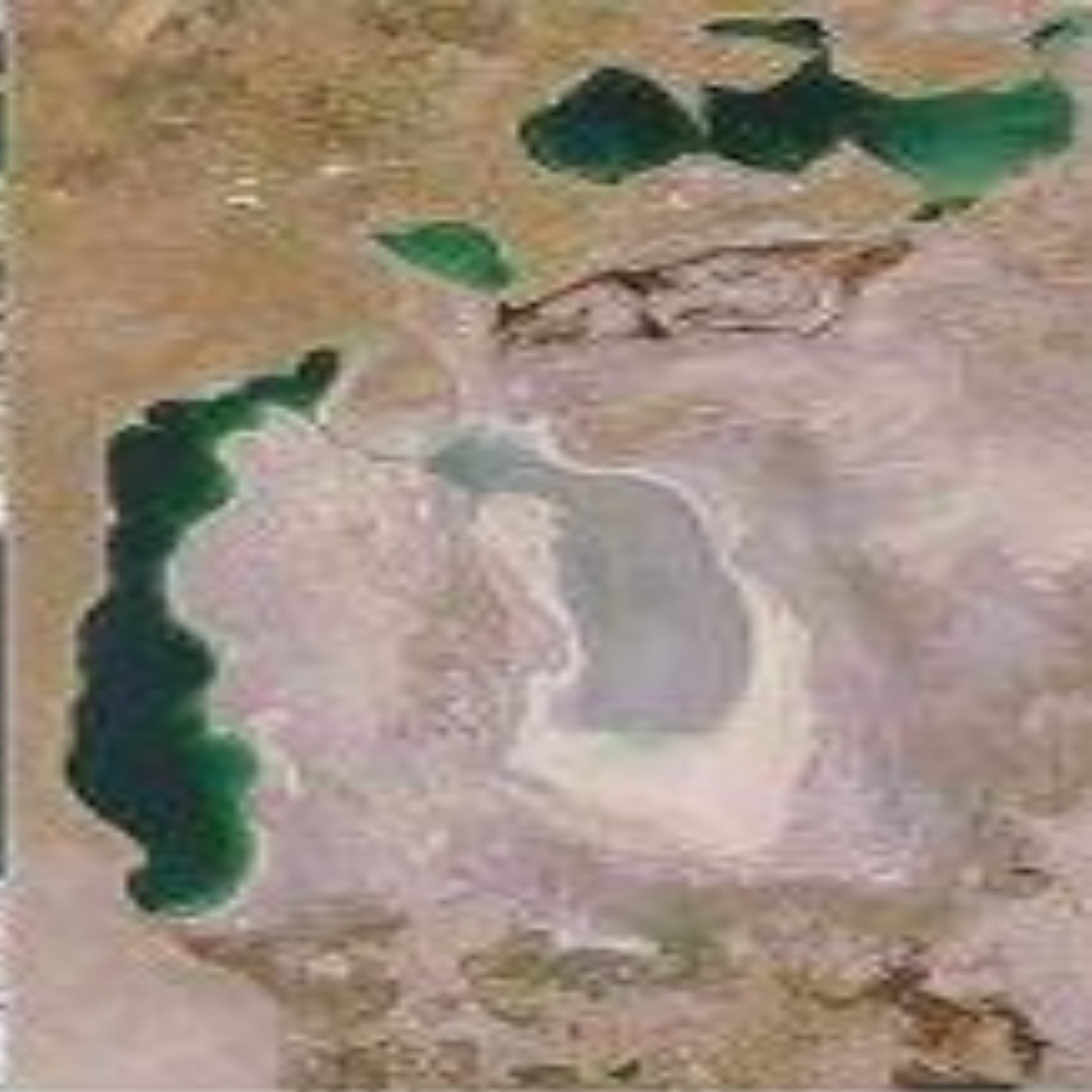
October 5, 2008