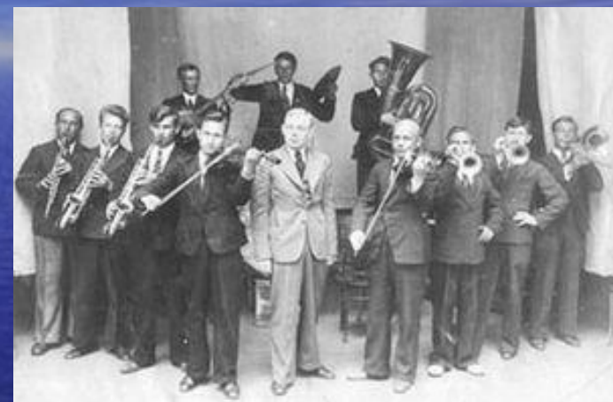
Первый в РСФСР эксцентрический оркестр джаз-банд Валентина Парнаха

Джаз-сцена зарождается в СССР в 20-е годы одновременно с её расцветом в США. Первый джаз-оркестр в Советской России был создан в Москве в 1922 г. поэтом, переводчиком, танцором, театральным деятелем Валентином Парнахом и носил название «Первый в РСФСР эксцентрический оркестр джаз-банд Валентина Парнаха». Днём рождения отечественного джаза традиционно считается 1 октября 1922 года, когда состоялся первый концерт этого коллектива. Первым профессиональным джазовым составом, выступившим в радиоэфире и записавшим пластинку считается оркестр пианиста и композитора Александра Цфасмана (Москва). Ранние советские джаз-банды специализировались на исполнении модных танцев (фокстрот, чарльстон).