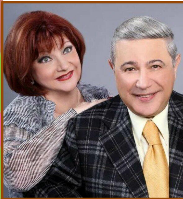
Е. Петросян и Елена Степаненко

Второй женой комика стала дочь оперного певца Ивана Козловского Анна. Женщина была старше супруга на 7 лет и прожила с ним в браке полтора года.