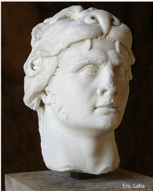
Митридат VI Евпатор 134–63 гг. до н.э.

На эллинистическом востоке у римлян остался только один мощный враг — понтийский царь Митридат VI Евпатор.