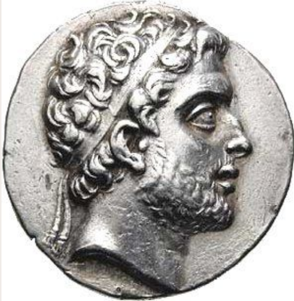
Филипп V Македонский 238–179 гг. до н.э.

Самым мощным государством на востоке была Македония.