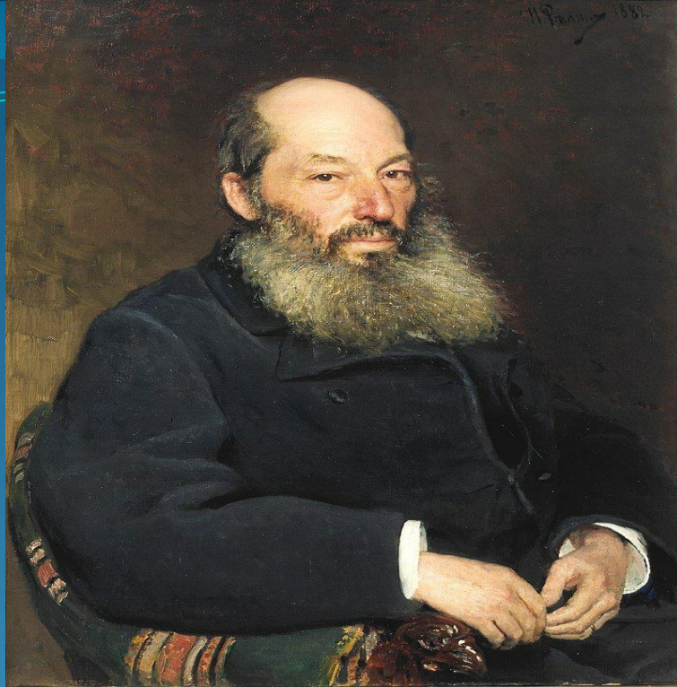
Афанасий Афанасьевич Фет 1820-1892