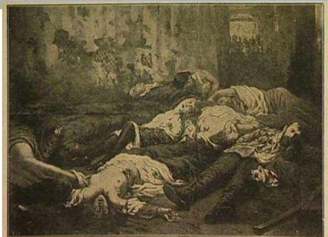
ЕКАТЕРИНБУРГСКОЕ ЗЛОДЪЯНИЕ. — 17 июля 1918 г.