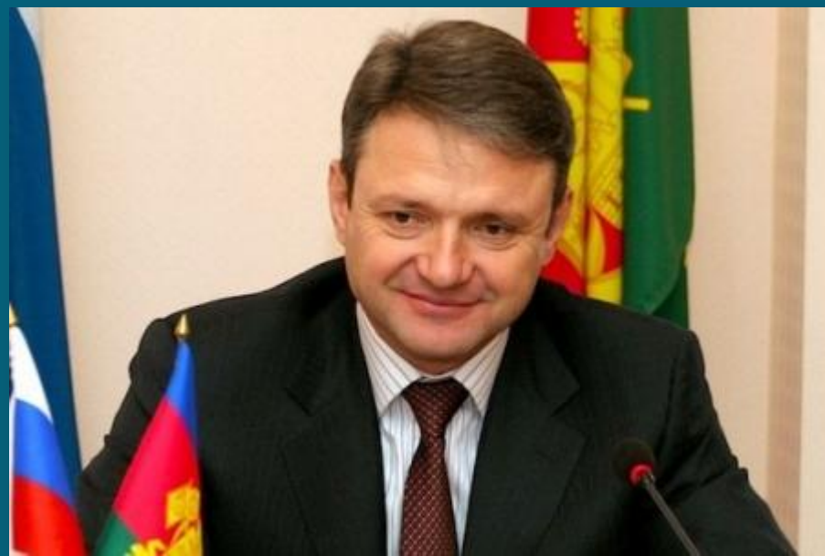
Александр Николаевич Ткачев (р. 1960 г.) губернатор Краснодарского края с 2001 г. по н.в.