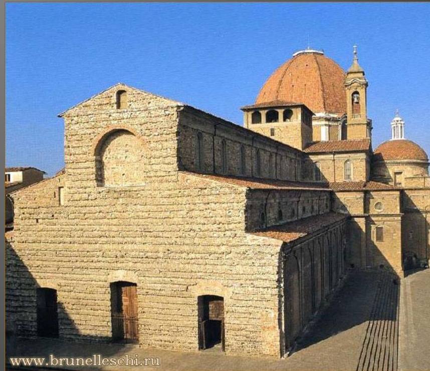
Церковь Сан Лоренцо, Флоренция