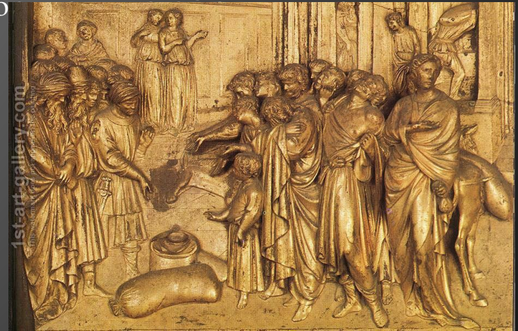
Лоренцо Гиберти. Бронзовые двери баптистерия. XV в. Флоренция.