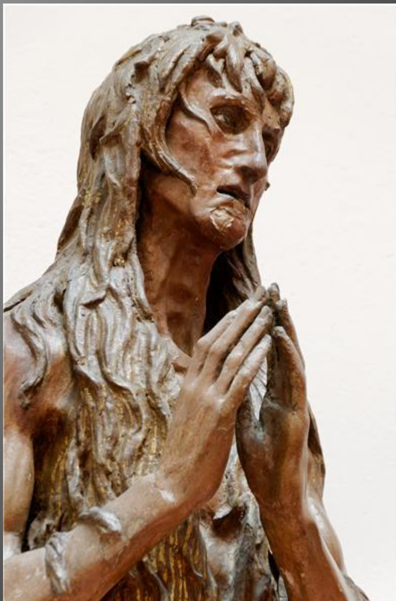
«Мария Магдалина» (1454–1455 гг.)