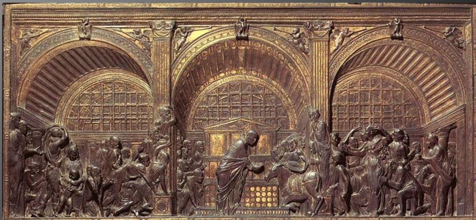
Рельеф Алтаря собора Сан-Антонио. Деяния Святого Антония