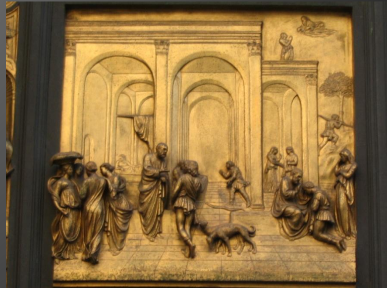
Лоренцо Гиберти. Бронзовые двери баптистерия. XV в. Флоренция.