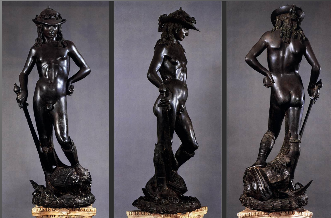
Донателло. Давид. XV в. Национальный музей Барджелло, Флоренция.