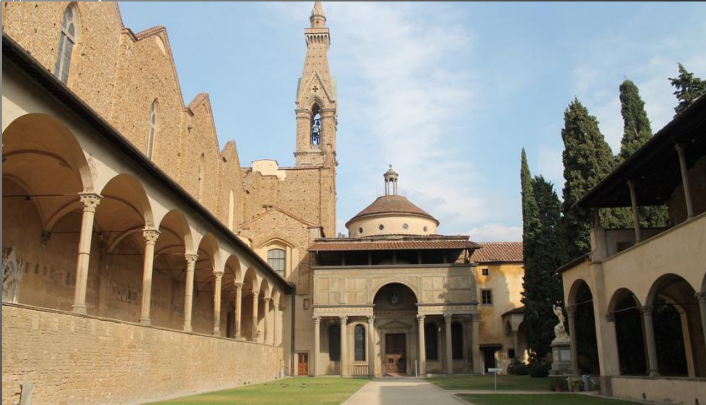
Филиппо Брунеллески. Капелла Пацци. XV в. Флоренция.