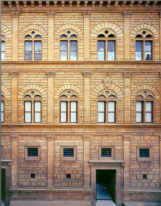
Леон Баттиста Альберти. Палаццо Ручеллаи. XV в.