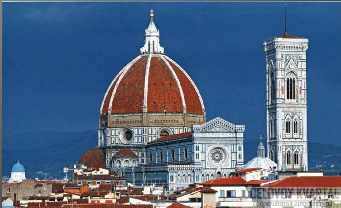
Филиппо Брунеллески. Купол кафедрального собора Санта- Мария дель Фьоре. XV в. Флоренция.