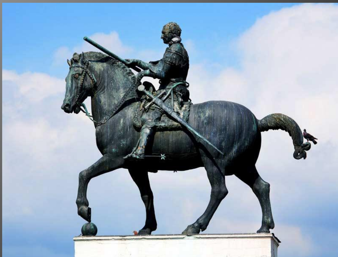
Конная статуя кондотьера Гаттамелаты. XV в. Падуя.