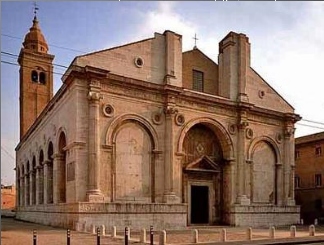
Церковь Сан Франческо в Римини