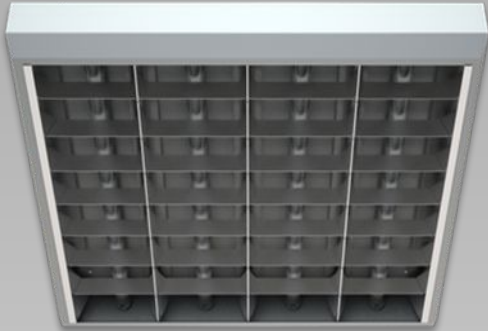
Светильник ARS/S UNI LED 600 4000К