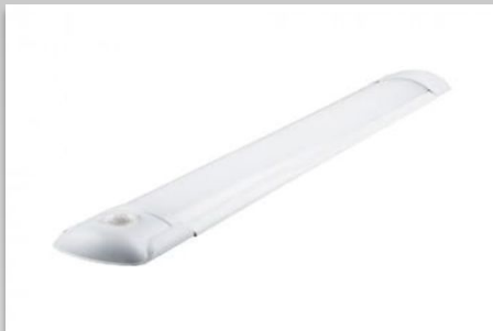
Светодиодный светильник FERON AL5064, 6500К, 32W