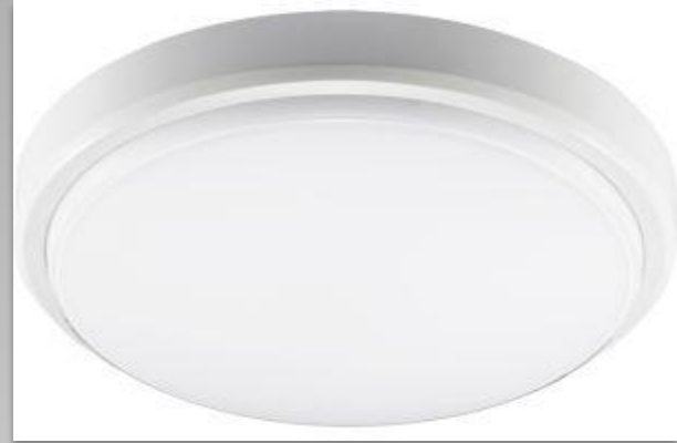
Светильник светодиодный PBH-PC2-RS 18Вт "SENSOR" (compact) 4000К с датчиком движения, Jazzway