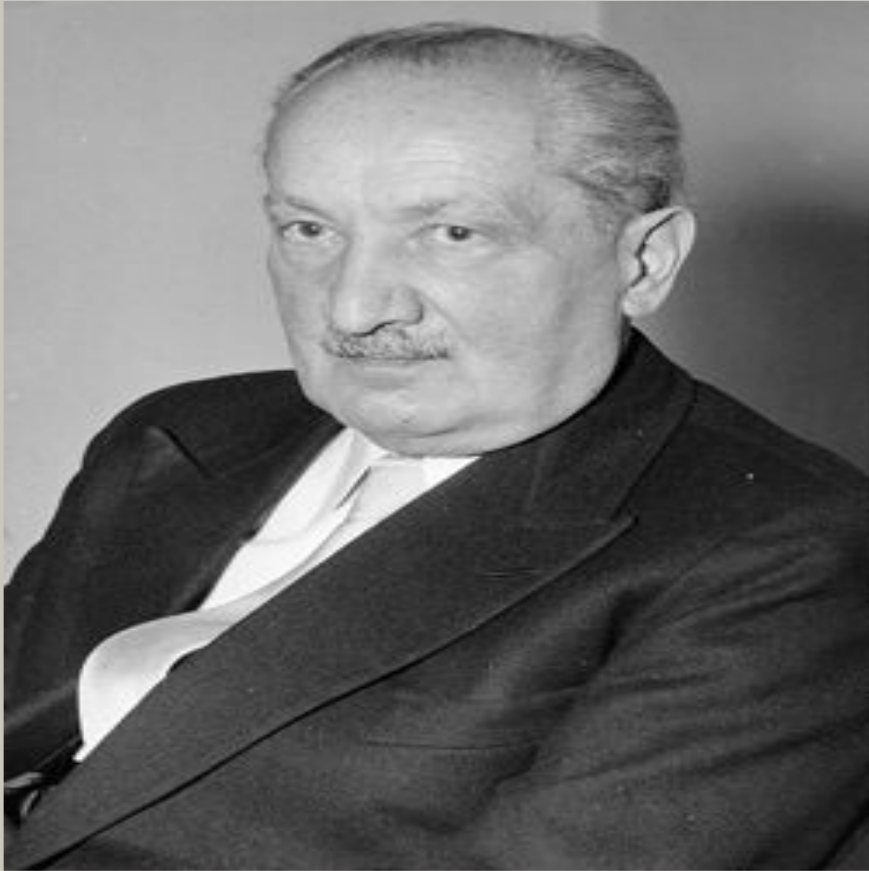
МАРТИН ХАЙДЕГГЕР (1889-1976)