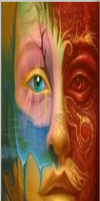
«ФЕНОМЕНОЛОГИЯ И ГЕРМЕНЕФТИКА»