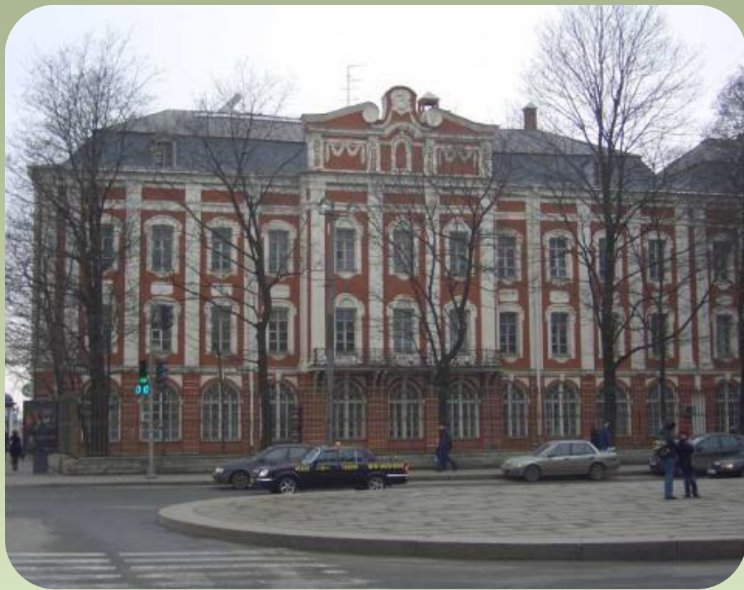
Здание Двенадцати Коллегий

В 1718 году Доменико Трезини выиграл первый в России архитектурный конкурс на строительство здания. Это сооружение - Здание Двенадцати Коллегий - первое каменное правительственное сооружение в Санкт-Петербурге.