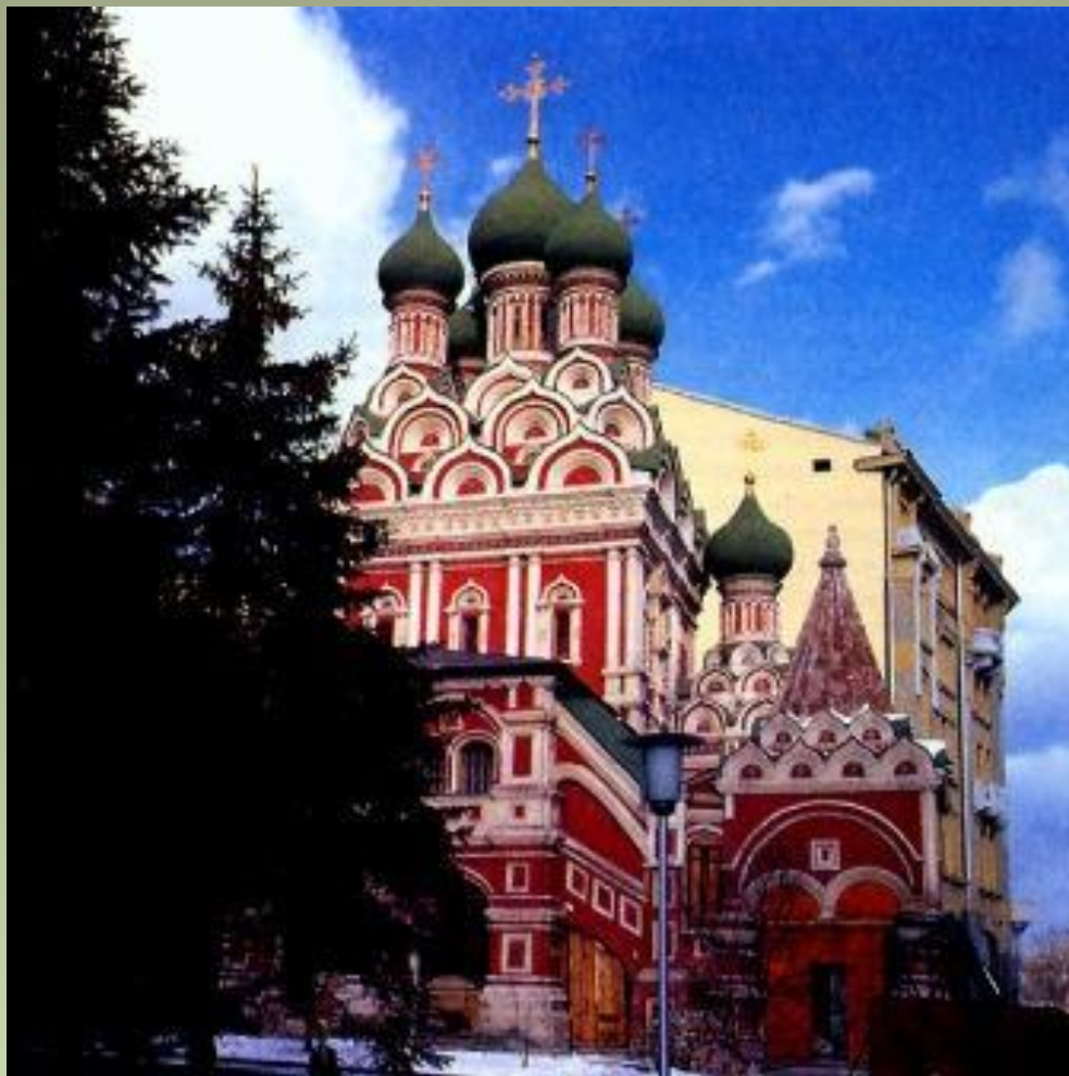
Церковь Троицы в Никитниках. 1631-1634 гг. Москва.