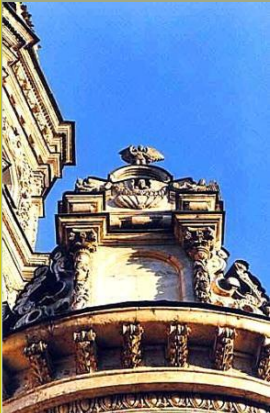
Церковь Знамения Богородицы в Дубровицах. 1690-1704. Москва.