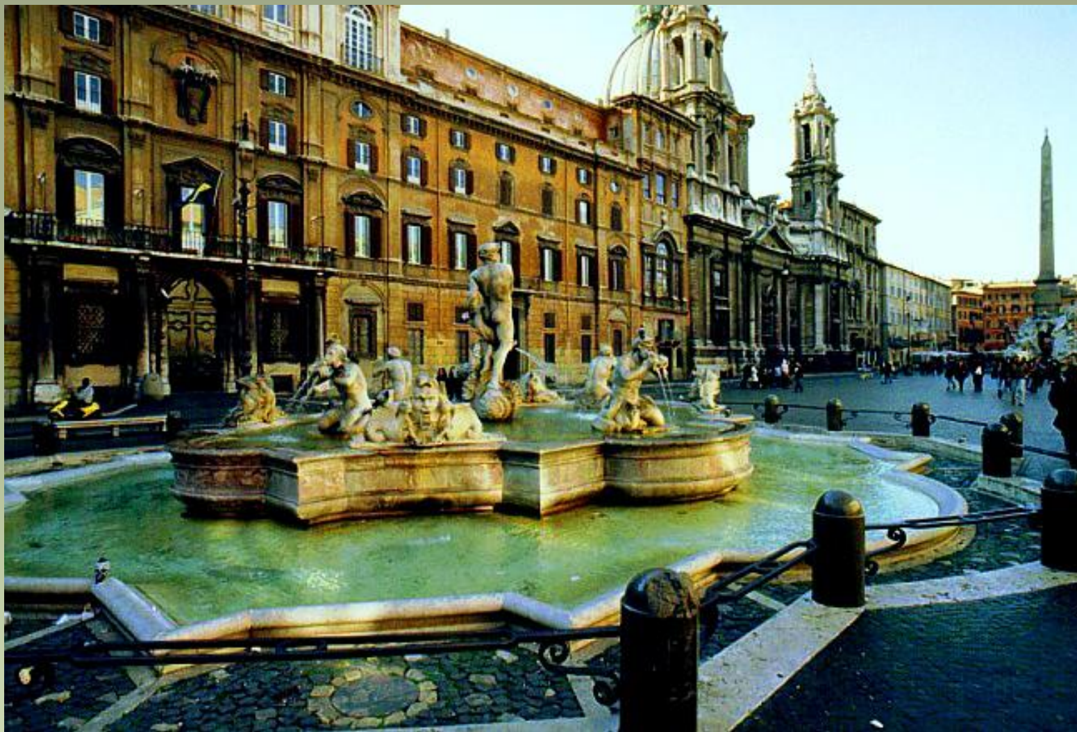
Лоренцо Бернини. Рим. Фонтан Нептуна на площади Навона.