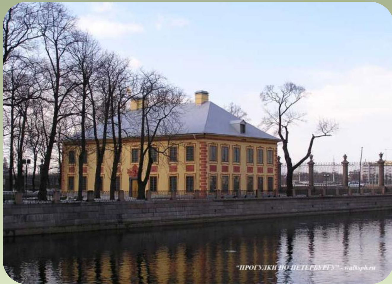
Летний дворец Петра I