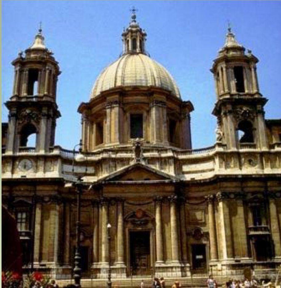
Франческо Барромини. Церковь Сант Аньезе. 1653 г. Рим.

Характерные черты итальянского барокко нашли наиболее яркое воплощение в творчестве двух зодчих, создавших целую эпоху в развитии архитектуры, - Франческо Борромини и Лоренцо Бернини.