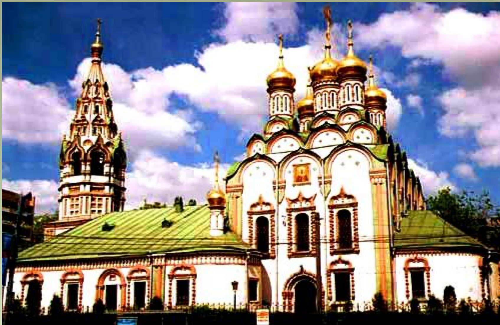
Церковь Николы в Хамовниках. XVII в. Москва.