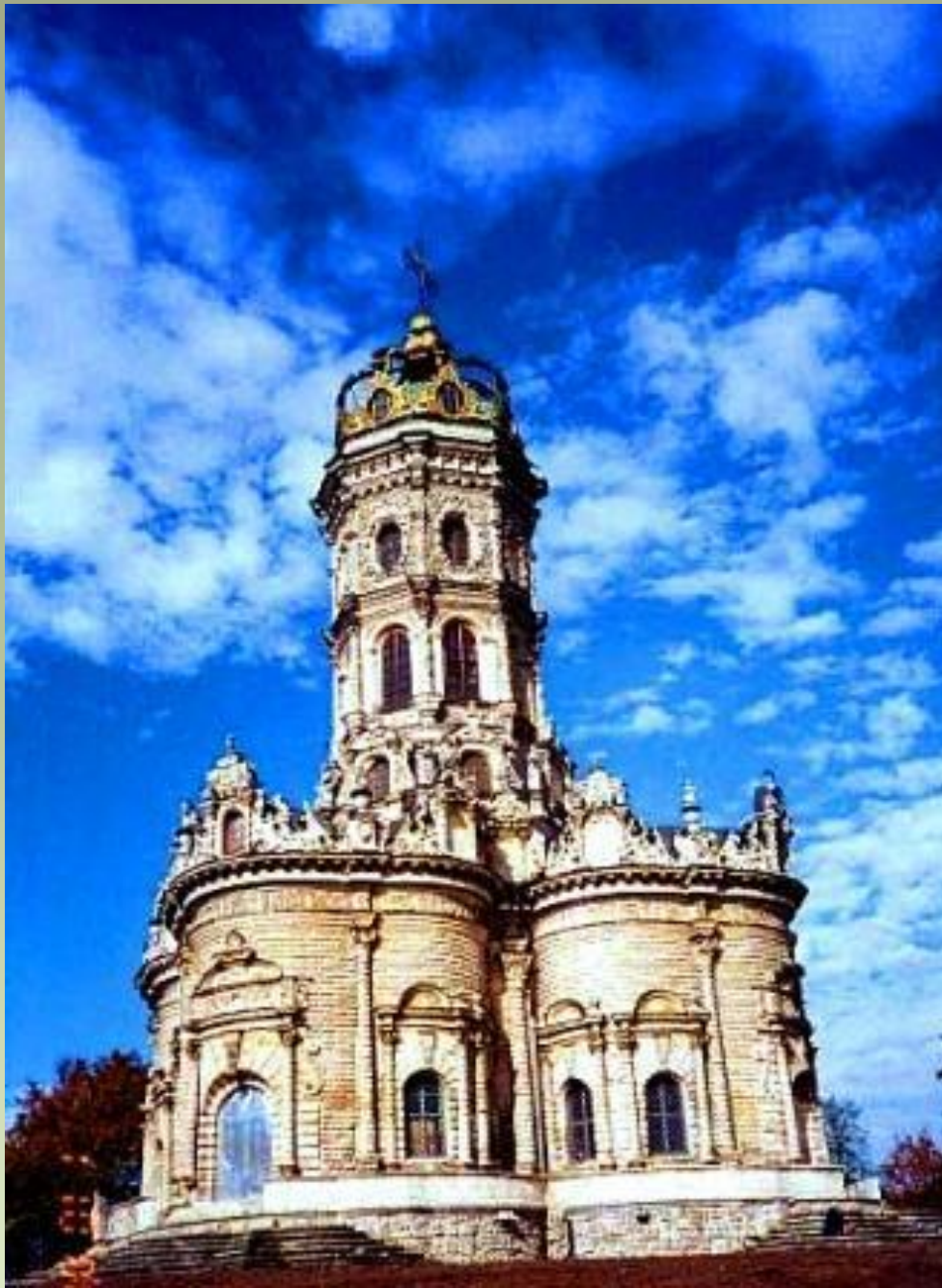
Церковь Знамения Богородицы в Дубровицах. 1690-1704. Москва.