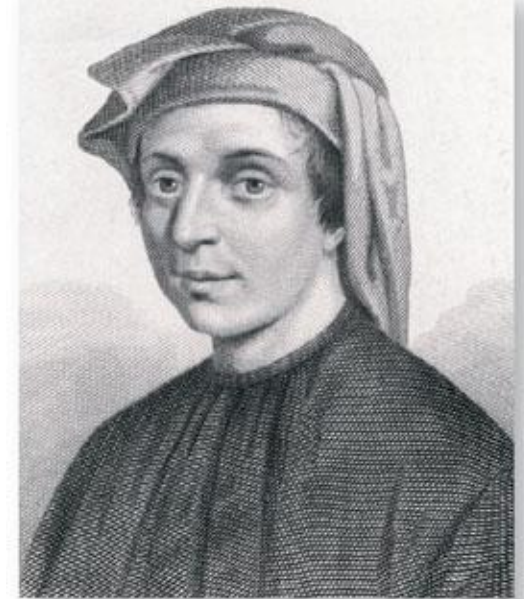
Leonardo Fibonacci 1180–1250