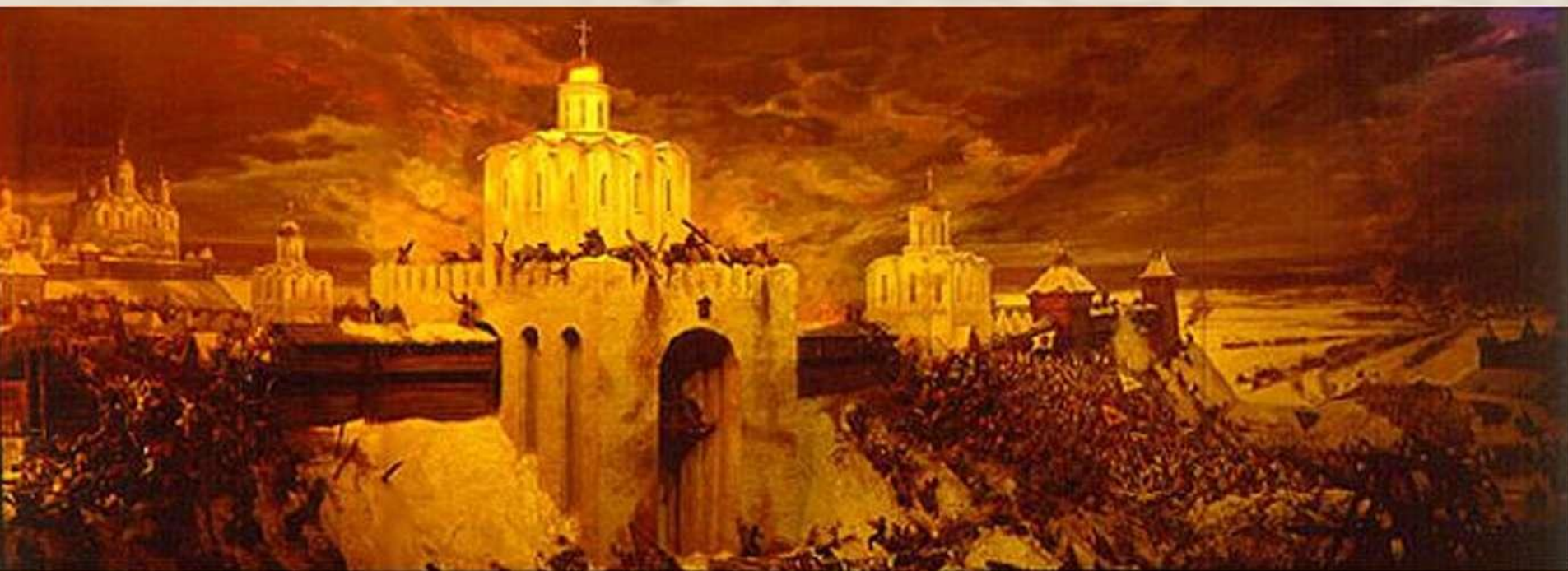
Нашествие хана Батыя на Русь

Это произведение - шедевр древнерусской словесности, первая повесть в истории русской литературы. Композиция произведения двухчастная.