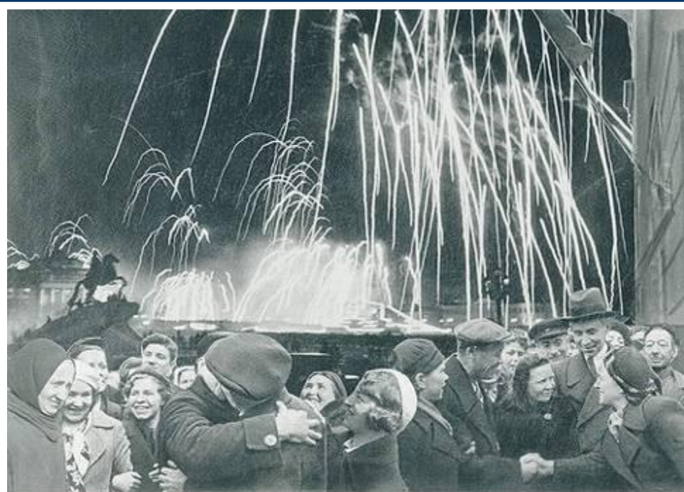
-Великая победа одержана советскими войсками под Ленинградом:

Победе радовалась вся страна, но эта радость была со слезами на глазах, так как в каждой семье, в каждом доме кто-то погиб на этой страшной войне.