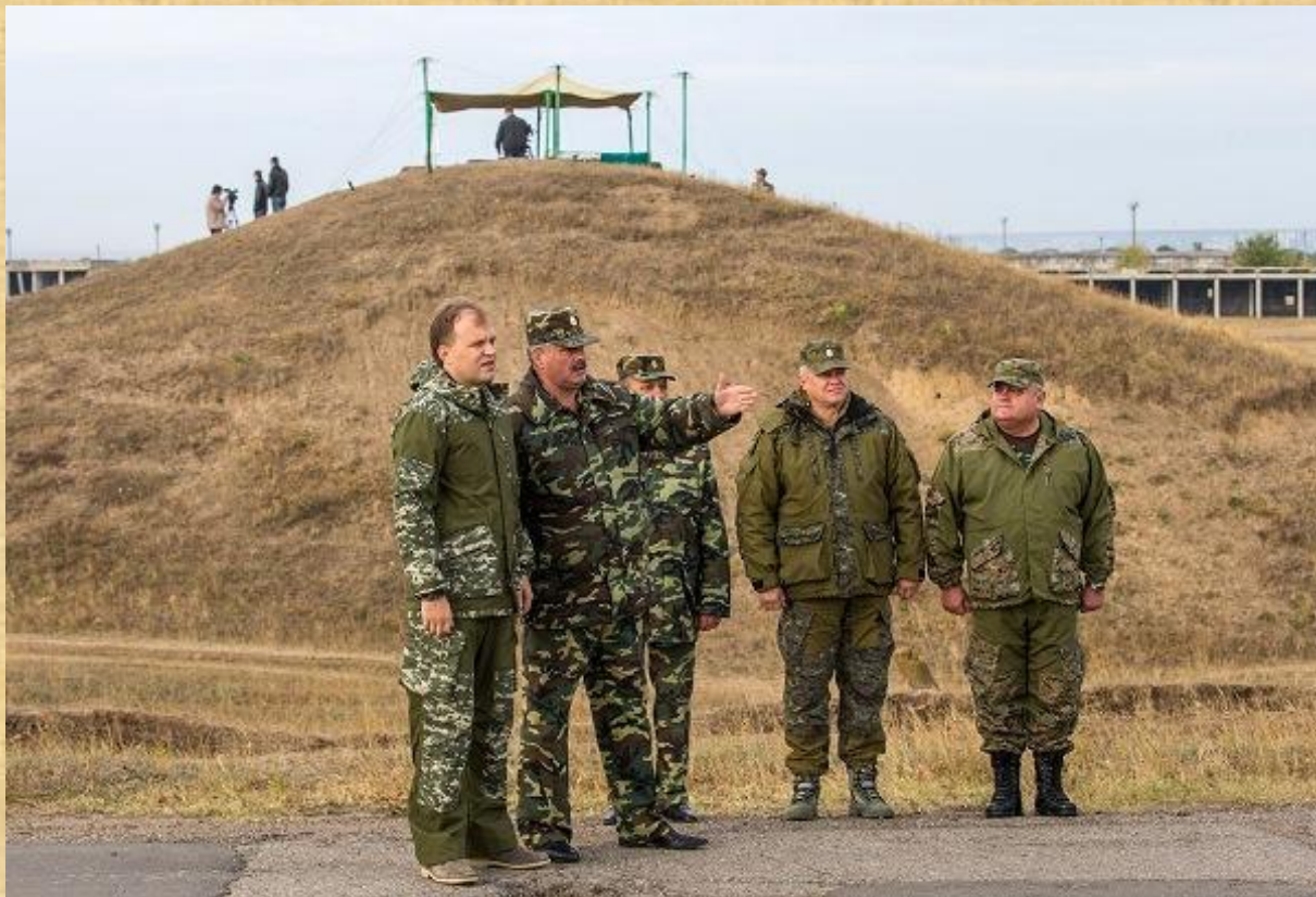
Главнокомандующий ставит задачу