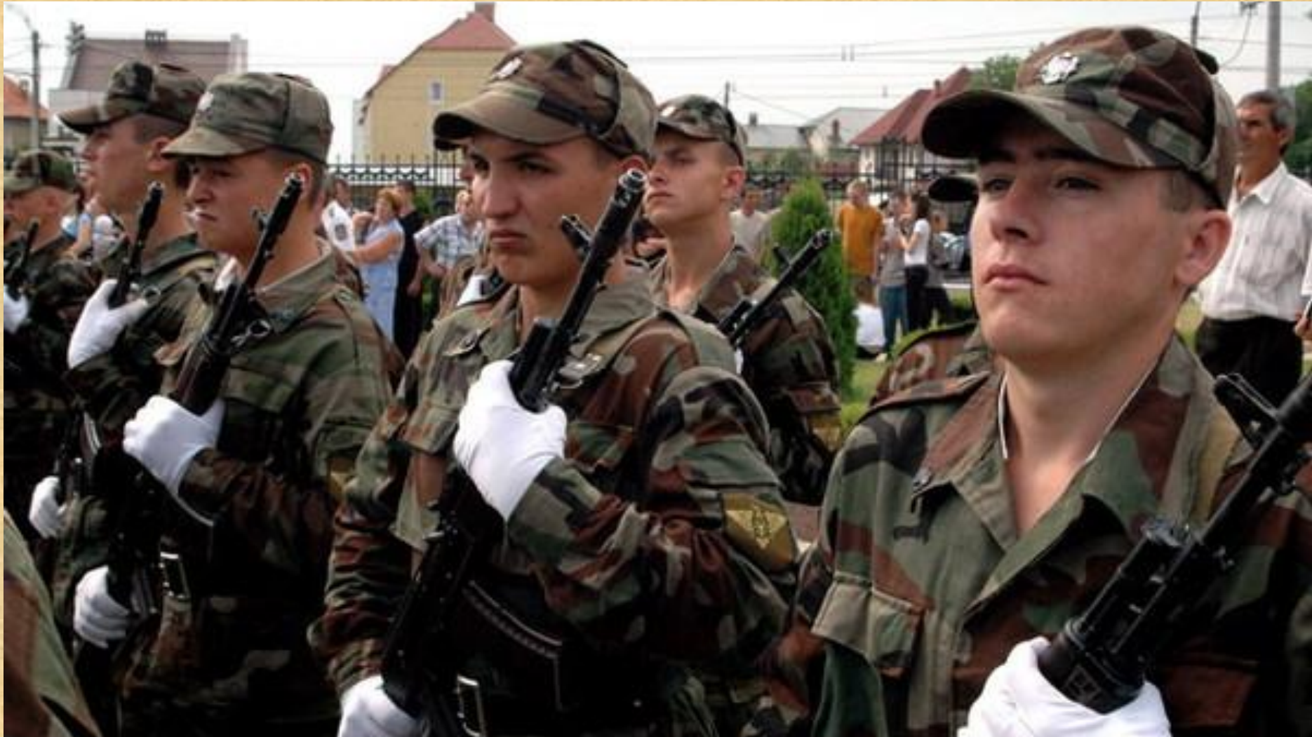
Солдаты молдавской армии.