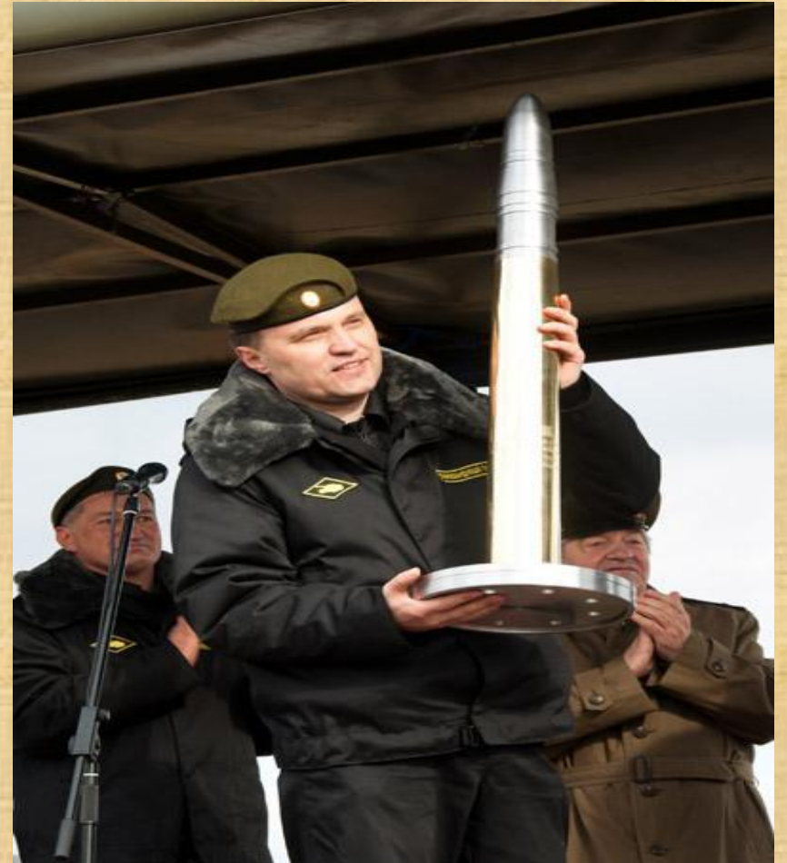
Верховный Главнокомандующий Е.В. Шевчук