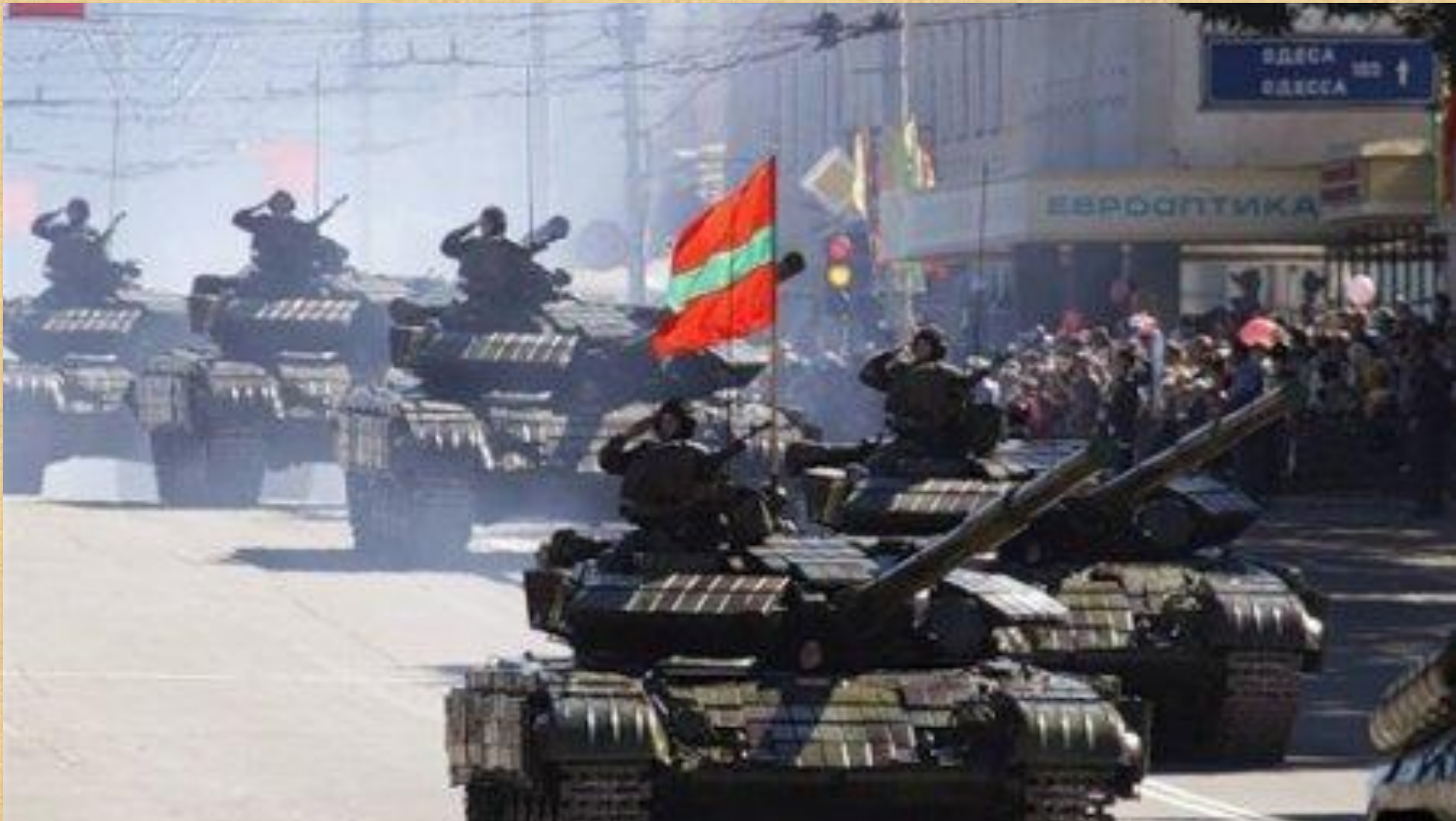
Грозные боевые машины на военном параде.