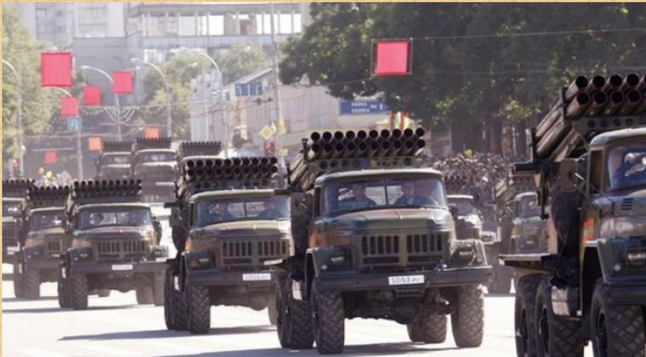
Реактивная артиллерия Приднестровья