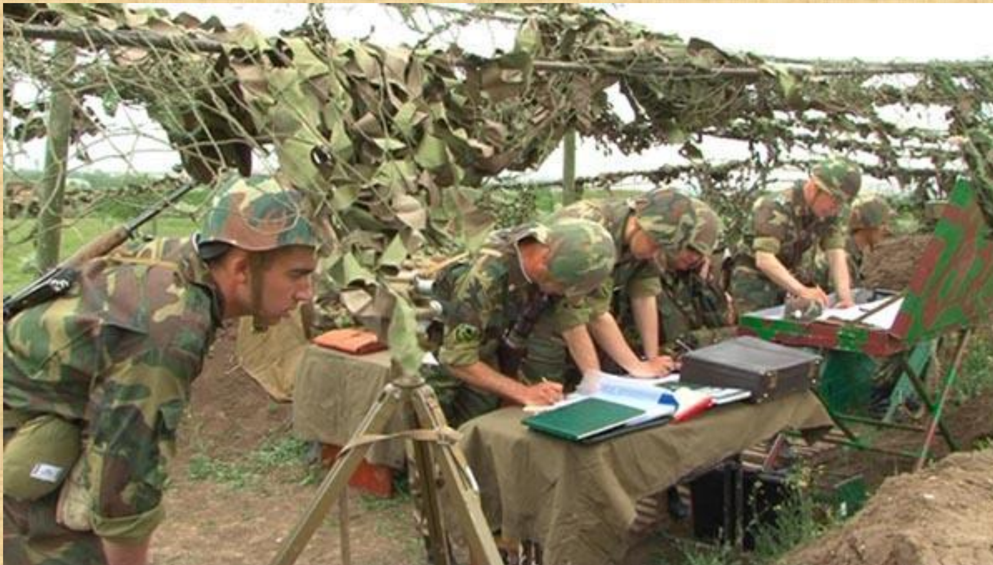
Боевая работа на наблюдательном пункте