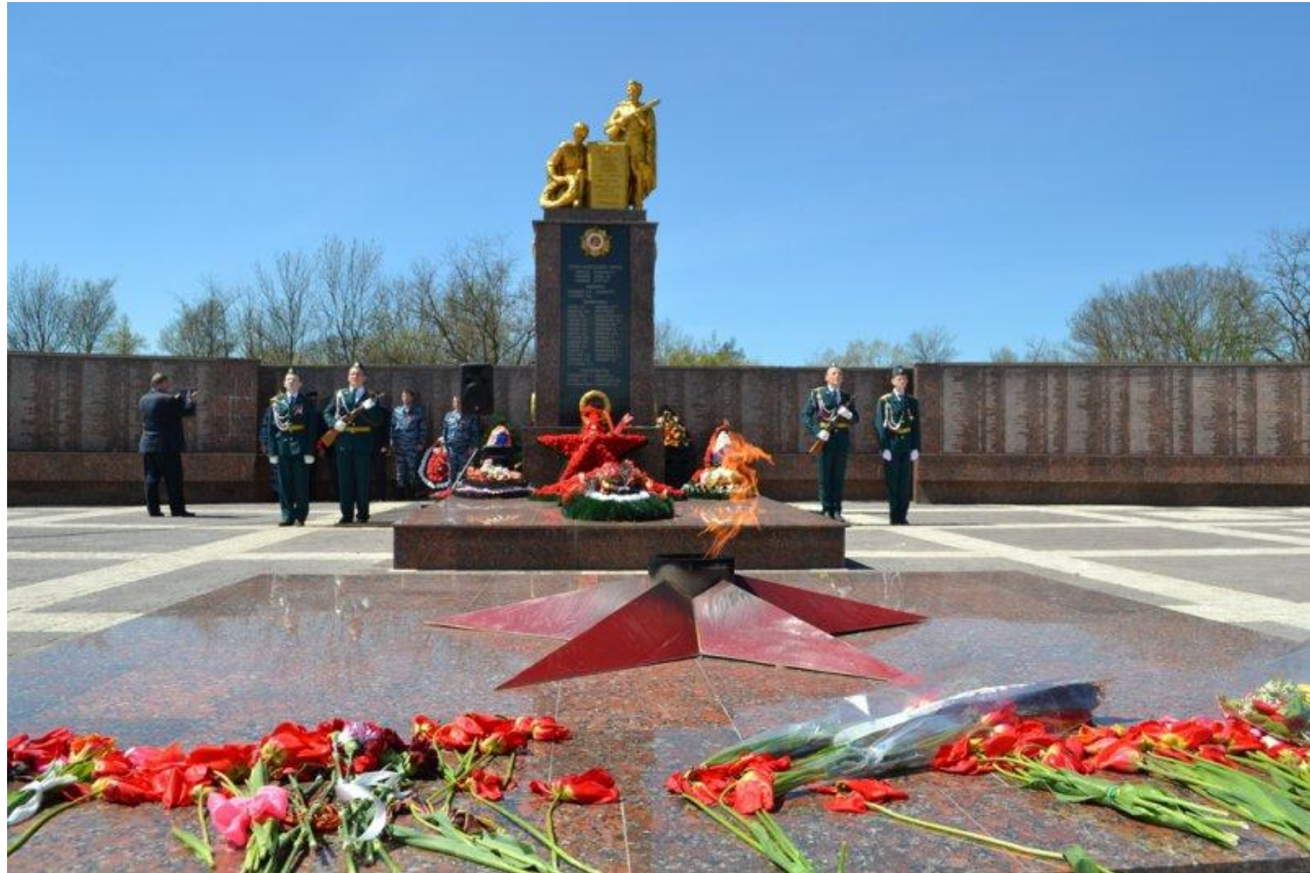
г. Крымск, ул. Комарова. Братская могила советских воинов, погибших в боях с фашистскими захватчиками.