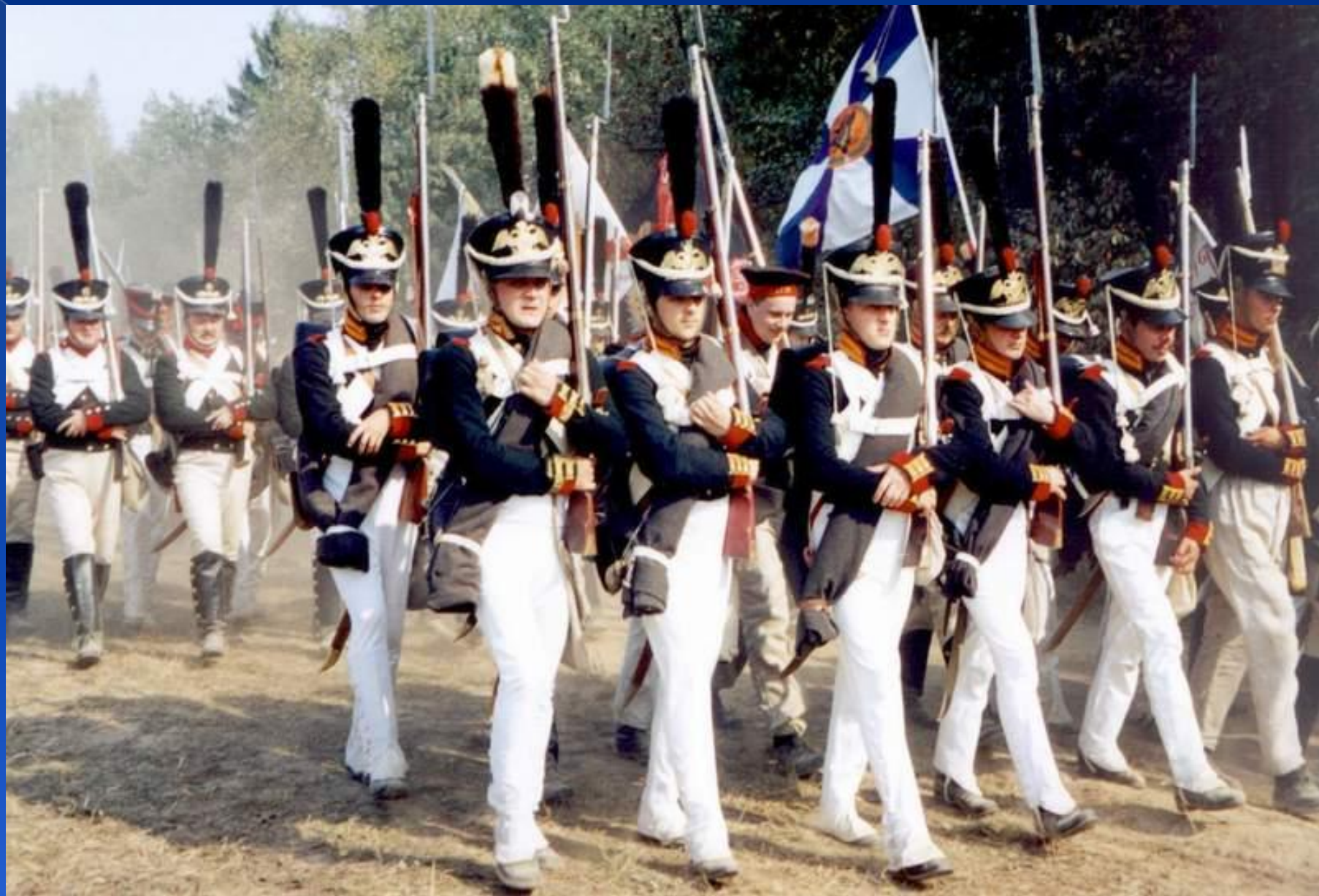
Семёновский лейб-гвардии полк