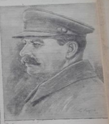
Председатель Государственного Комитета Обороны и Народный Комиссар Обороны тов. Н. В. Жуков.

Вчера трудившиеся города и района отменял день Первого Мая Стахановской работой на фабриках и заводах, на колхозных полях. Перевыполнением яри и явном трудившемся города и района демонстрируют свою преданность родным, великому Сталину, готовность бороться до полной победы над врагом. Вчера трудившиеся города и района отменял день Первого Мая Стахановской работой на фабриках и заводах, на колхозных полях. Перевыполнением яри и явном трудившемся города и района демонстрируют свою преданность родным, великому Сталину, готовность бороться до полной победы над врагом.