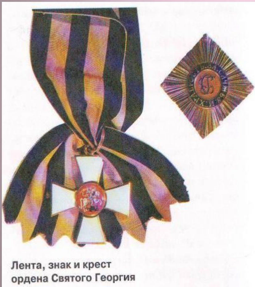
Лента, знак и крест ордена Святого Георгия