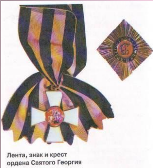
Лента, знак и крест ордена Святого Георгия