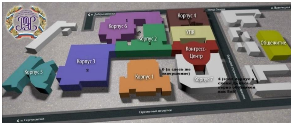
Рис. 1 Маршрутный лист квеста «Оборона Москвы. Дорога к Победе» (станции и их очередность указана цифрами)