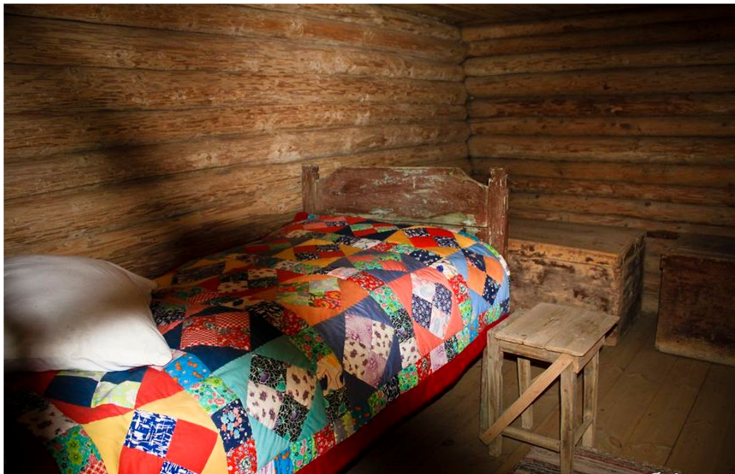
Кровать Сергея Есенина.