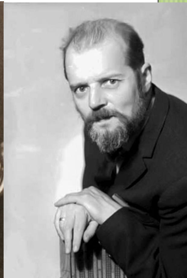
Александр Есенин- Вольпин