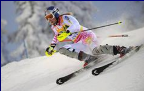
■ Le ski alpin