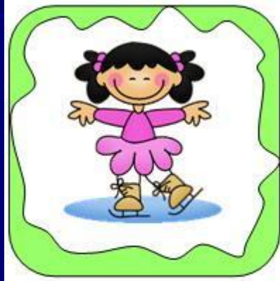
le patinage artistique